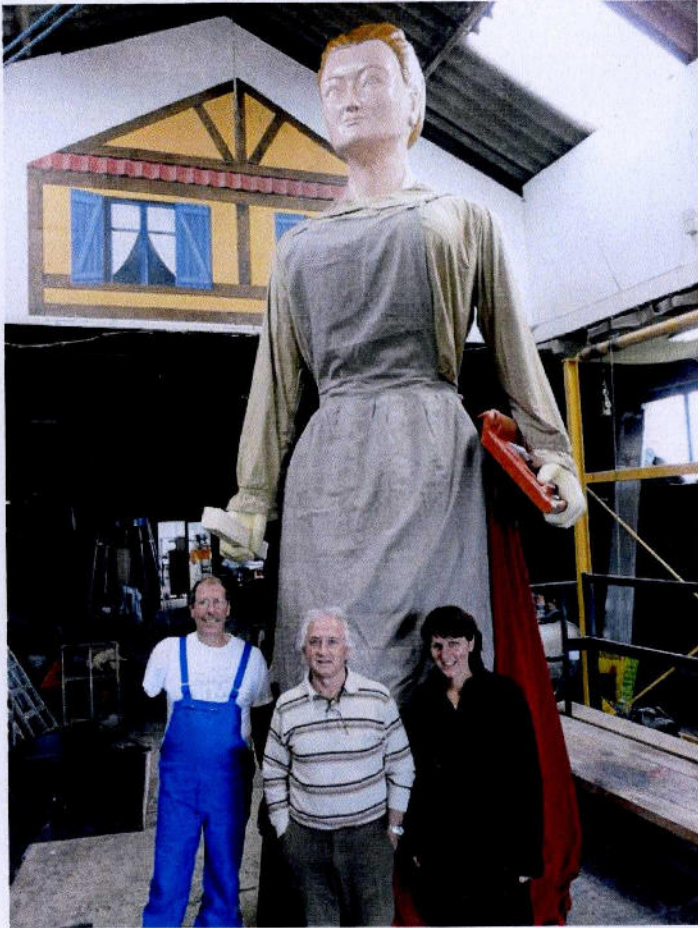
La géante Watten' Dame entourée de ses artisans

Et à l'occasion de son vingtième anniversaire, il va se marier avec la belle Watten Dame