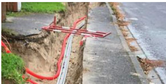
ENFOUISSEMENT DES RESEAUX électrique, téléphone, éclairage public