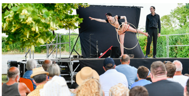
La 5 è SAISON Retour au spectacle vivant