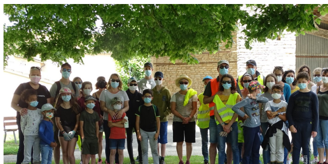
PRÉSERVER LE PATRIMOINE NATUREL de la commune