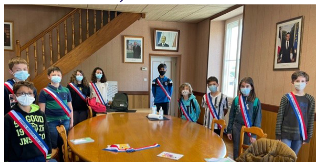
REALISATIONS ET PROJETS Journée déchets, hôtel à insectes...