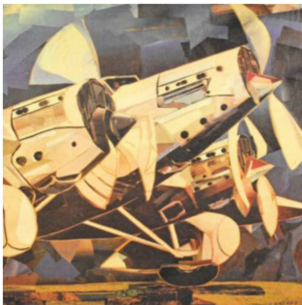
André Gréard utilisait le collage comme moyen d'expression