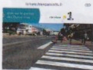
A Saint-Denis, dans le quartier de Chaudron, un enfant a été percuté par une moto. Âgé de 9 ans, il est actuellement en coma. Le motard qui participait à un rodéo sauvage est en attende de vue.

C'est la proximité de l'Ecole qui a provoqué cette disposition.