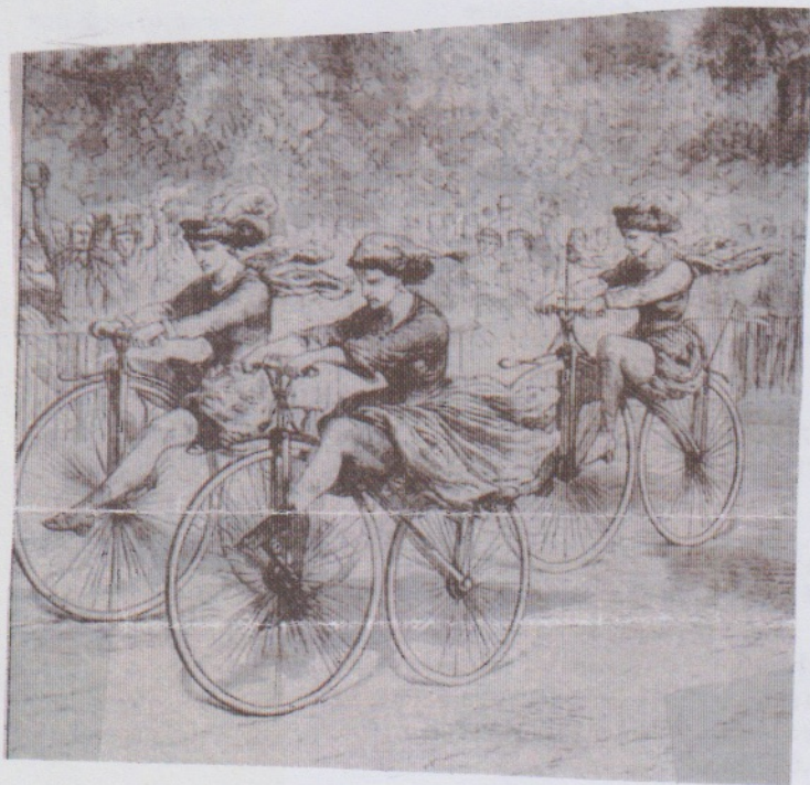
La première course cycliste féminine en 1868. Illustration tirée du Courrier Picard en date du 7 Avril 2016 .

LA CROIX ROUGE, qui a assuré tant de nos courses cyclistes et pédestres, pour ne pas parler des duatlons, lance une campagne de sensibilisation auprès du grand public en général et du public de Ponchon en particulier. Elle se déroulera jusqu'au 7 Mai. Les représentants de la Croix-Rouge seront identifiables par leurs uniformes aux couleurs de la Croix-Rouge.