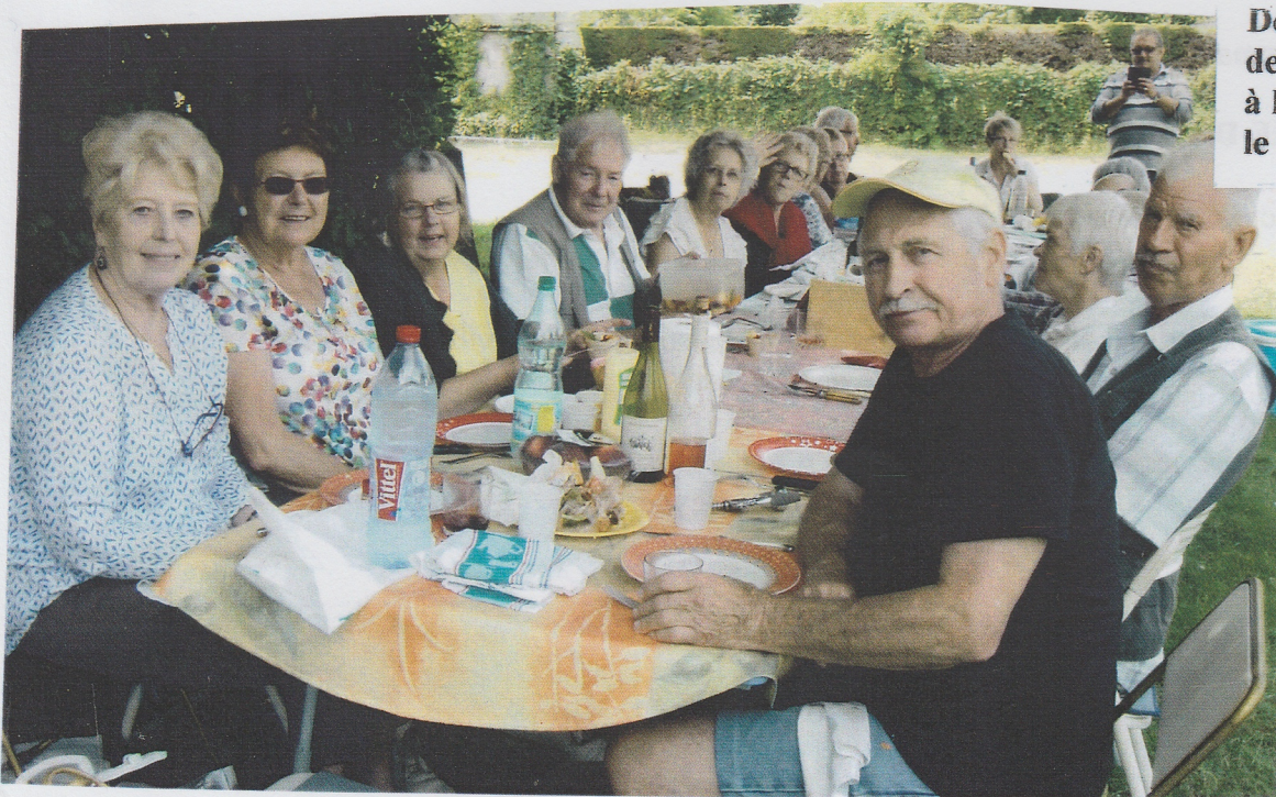
Déjeuner du Rallye de l'Amicale, à la Chapelle aux Pots, le 26 Juin 2017.

Si vous êtes victime d'un incident (arnaque, technique de vol, cambriolage...), envoyez une alerte aux membres de votre communauté pour les informer. En cas d'urgence, ne vous mettez pas en danger, contactez le 17 !