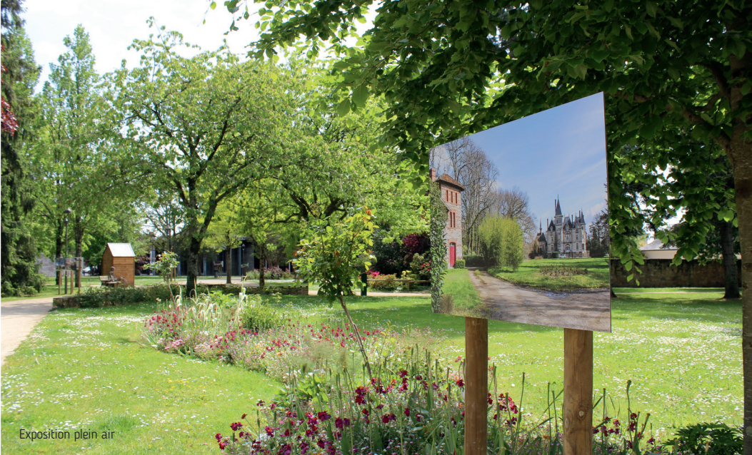
Exposition plein air