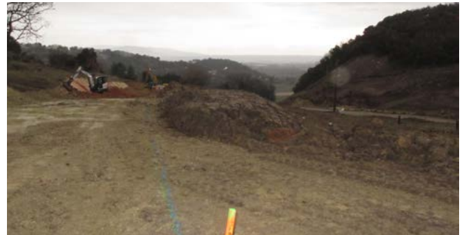
Travaux de déviation du chemin de Mayour à la Montagnole

Sur le contournement, les travaux avancent et le tracé se matérialise. Le ferrailage du tablier du viaduc de Frayol est actuellement en cours et prochainement sa partie bétonnée sera coulée. Le chemin de Mayour a, quant à lui, été dévié près de la Montagnole. Les véhicules circulent à présent sur la nouvelle section aménagée. Il reste encore à dévier une partie de ce chemin, près du Chambeyrol ; il passera alors sous l'ouvrage d'art n°4.