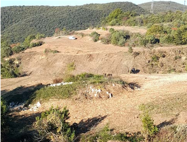
Vue depuis le chemin du Réservoir en direction de Saint-Pierre

Les dernières coupes d'arbres sur les emprises du contournement du Teil ont eu lieu entre le 1 er septembre et le 15 novembre 2021. L'Office National des Forêts, titulaire du marché public, est intervenu notamment sur les secteurs de Saint-Pierre, de Chabassot et de Courion sur la commune du Teil et près du chemin de Mayour et de l'impasse du Chambeyrol à Rochemaure. Une opération de débroussaillage a été également nécessaire sur certains secteurs. Les emprises de l'intégralité du tracé sont désormais dégagées et visibles sur site.