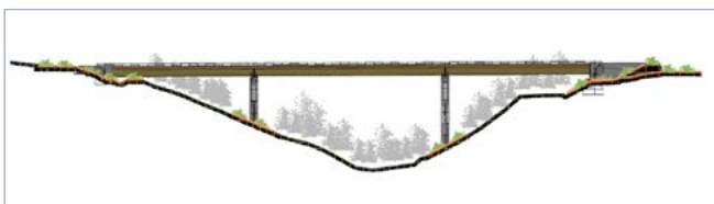
Élévation du viaduc du Chabassot

D'une longueur de 150 mètres , avec deux piles de 17 et 23 mètres de haut, le viaduc permet de franchir le ravin de Chabassot sur la commune du Teil. Comme le viaduc de Frayol, il s'agit d'un ouvrage composé de piles en béton armé, de poutres métalliques, surmontées d'un tablier en béton armé. Le principe de construction est le même que celui du viaduc de Frayol : la charpente métallique est assemblée et soudée sur site près de sa localisation définitive. Elle est poussée jusqu'à ce qu'elle rejoigne sa position finale. Lorsque la charpente est en place, le tablier en béton armé est réalisé. Dernière étape : les équipements (garde-corps, glissières...) sont mis en place.