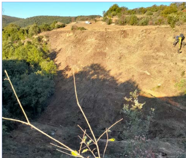
Ravin de Chabassot