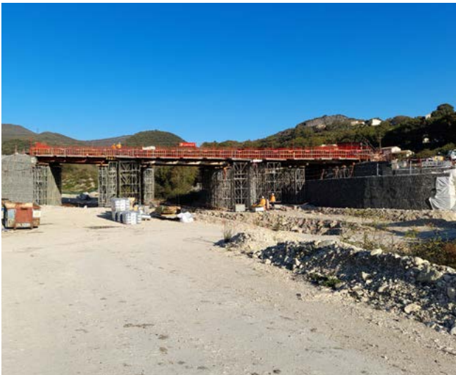
Ouvrage de franchissement du Chambeyrol et du chemin de Mayour (OA n°4)