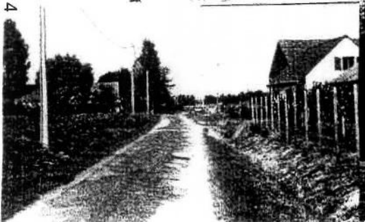
Rue de 5-sept. 44 qu'on est hii à droite : ma maison natale