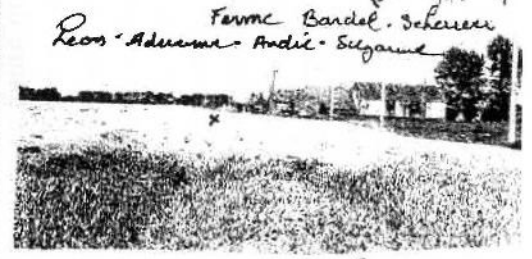
Ferme Bardel champ de Bte autrefois Bakawes x x - Emplacement des 2 corps