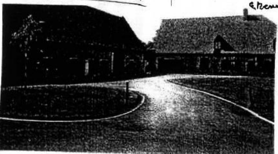
Ferme Ammeux aujourd'hui une grand forte surface le mur de l'Écurie -