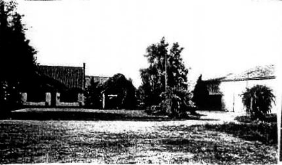
Ferme Demol l'Hangar remplace le moulin à vent -