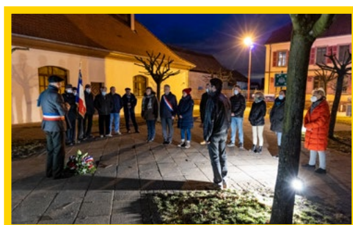
77 ÈME ANNIVERSAIRE DE LA LIBÉRATION DE SUNDHOFFEN LE 4 FÉVRIER 2022