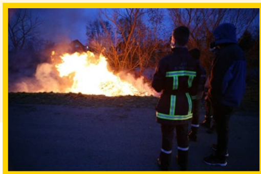
CRÉMATION DES SAPINS ORGANISÉE PAR LES SAPEURS- POMPIERS LE 8 JANVIER 2022