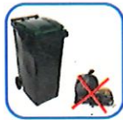
Sacs hors du bac