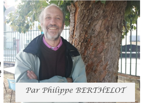
Par Philippe BERTHELOT

Derrière nos 59 rues cannoises, notre imagination se plaît à réfléchir à l'origine des noms. Mais l'histoire nous guide plutôt vers une anecdote savante rappelée par Philippe Berthelot. Petit tour d'horizon des voies de la commune. Partie 2.