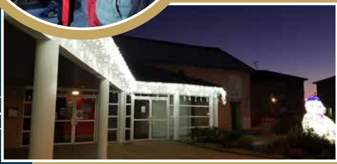
Les traditionnelles illuminations sur la commune, avec pour cette année des nouveautés notamment sur Cassepierre.