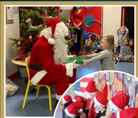
Passage du Père Noël à l'accueil de loisirs.