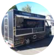
Mercredi soir : Le Foodistador Burgers