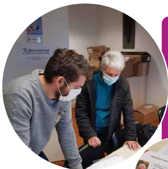
Le service urbanisme accompagne les agents recenseurs.

Un service avec une pluralité de tâches et surtout une volonté d'amélioration et de bien être pour les habitants de Rilhac Rancon.