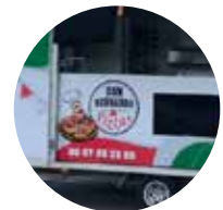
Samedi soir : Don Bernardo Pizzas

Rencontrer les conseillers départementaux c'est possible !