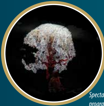
Spectacle "Hoël" dans le cadre de la programmation culturelle.