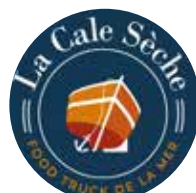
Jeudi soir : La Cale Sèche Traiteur produits de la mer