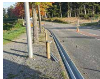
Pose d'une lisse en bois rue Beaune.

● En complément nous sommes intervenus au niveau des travaux mutualisés entre les équipes de Rilhac rancon et la subdivision nord de Limoges métropole et nous avons participé à la réalisation de différentes opérations (élagage, abattage d'arbres gênants remplacés par de nouvelles essences plus adaptées) sous la responsabilité de Limoges métropole.