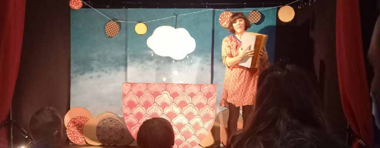
Spectacle "Miyuki" présenté par la Compagnie "Mon petit théâtre".