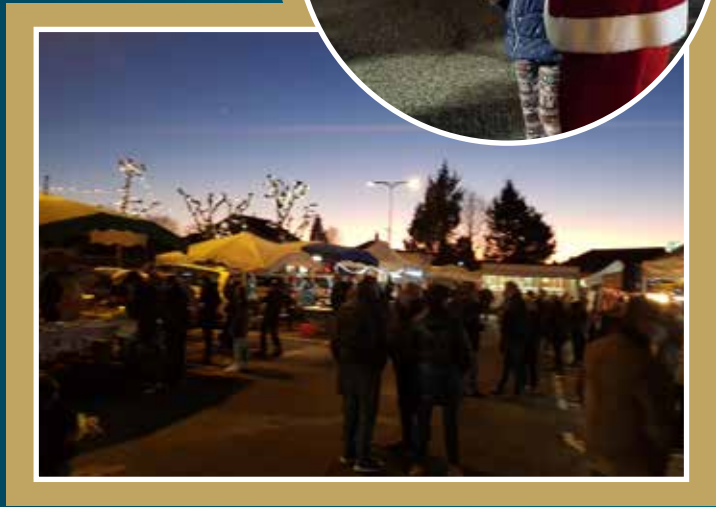
Deuxième édition du marché de Noël