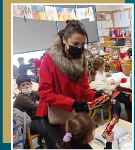
Distribution de chocolat aux enfants des écoles.