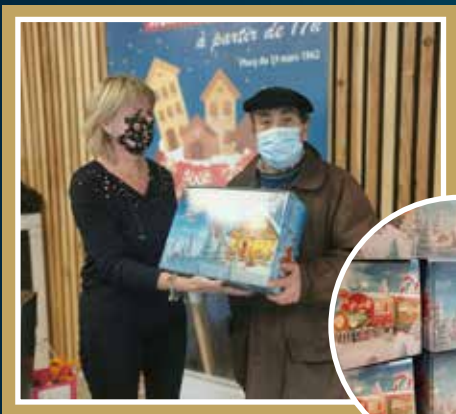
Distribution du colis aux aînés de la commune.