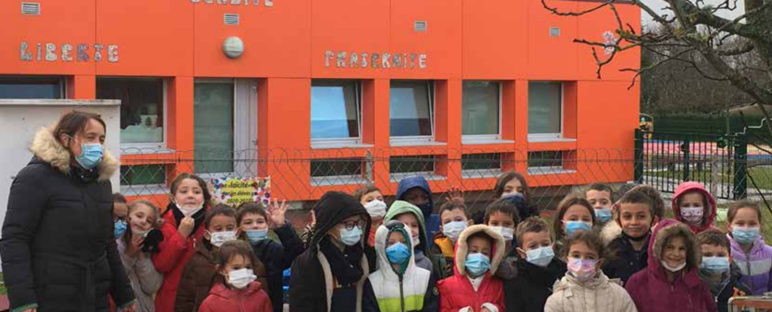
Les élèves ayant participé au projet lorsqu'ils étaient en Grande section.