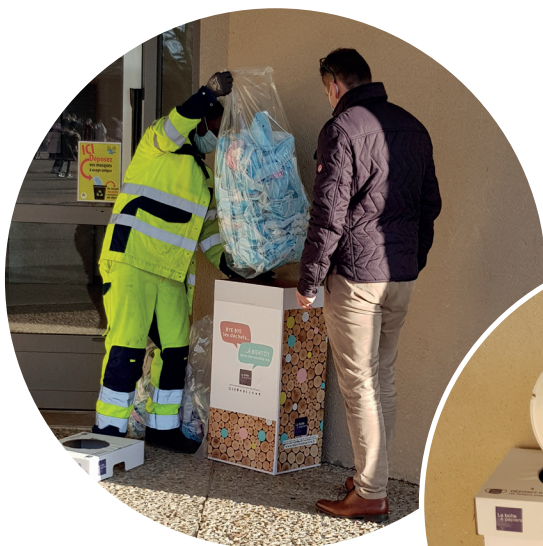
Collecte des masques à l'école Jean-Jaurès par la boîte à papier.

Vous pouvez les stocker chez vous provisoirement dans un sac plastique et les déposer avec le sac dans un des bacs mis à votre disposition. ■