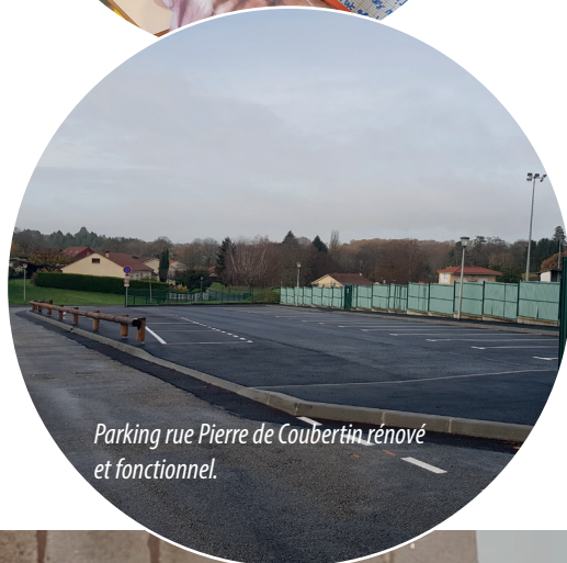
Parking rue Pierre de Coubertin rénové et fonctionnel.

● La création de la classe ULIS (Unités Localisées d'Inclusion Scolaires) au sein de l'école Jean Jaurès dont les travaux ont été entièrement réalisés en régie par le personnel communal des «services techniques». La rénovation de cette pièce et la création de cette classe ont permis de recevoir à la rentrée scolaire 2020 11 élèves des communes voisines afin qu'ils puissent recevoir un enseignement adapté et leurs inclusions dans les classes ordinaires de notre école.