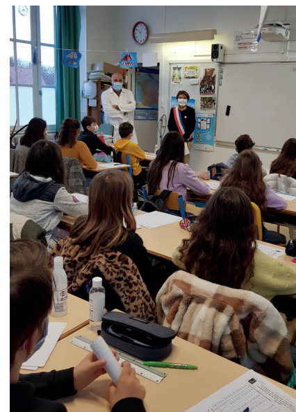
Temps d'échange entre les élèves de la classe de M. Brunie et madame le Maire.

● De leur côté, les élèves de Saint Exupéry ont réalisé des lettres représentant les symboles de notre république : Liberté, Égalité, Fraternité. Ceci a permis à l'équipe pédagogique des moments d'échanges sur ces notions fondamentales qui font le ciment de notre nation. Ces belles réalisations pourront très prochainement orner le fronton de l'école. ■