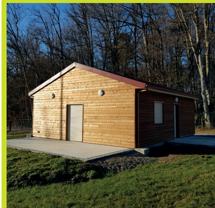
Le Chalet situé aux abords du terrain de pétanque et du parc des sports.

Le but Rilhacois, grâce à ses investissements financiers et humains bénéficie également d'un équipement important pour la convivialité, un chalet qui permettra aux membres après avoir lancé le cochonnet de se retrouver dans un esprit de camaraderie. ■