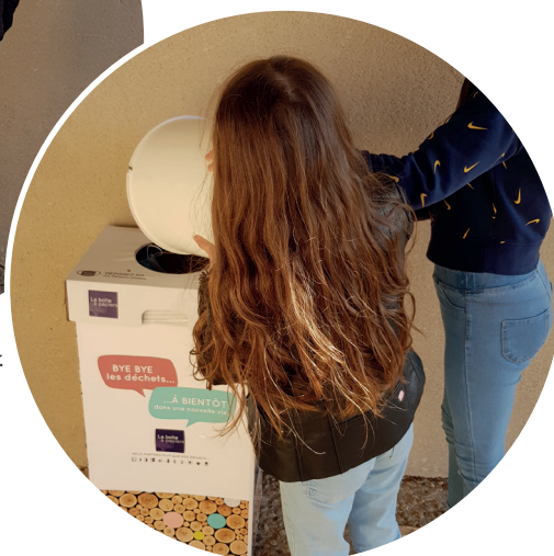
Les enfants des écoles investis dans la récolte et le recyclage des masques jetables.