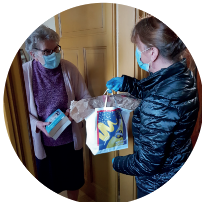
Livraison de courses alimentaires et d'une réservation de livres auprès de la médiathèque par le service de soutien.

La municipalité par le biais du CCAS renforce son équipe de soutien sur le territoire de la commune en ces moments difficiles et souhaite prolonger cette action tout au long de l'année.