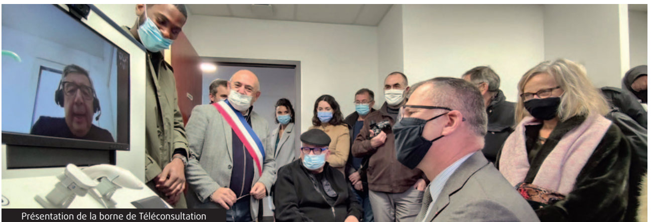
Présentation de la borne de Téléconsultation

Cette téléconsultation a beaucoup plu aux intéressés qui ont vu le potentiel que pouvait générer cet appareil. Pour autant, la recherche d'un médecin est toujours en cours puisqu'un local lui est dédié au sein de l'Espace Santé. La commune continue de publier des annonces notamment sur le site internet « Soigner en Périgord » plateforme officielle du département de la Dordogne.