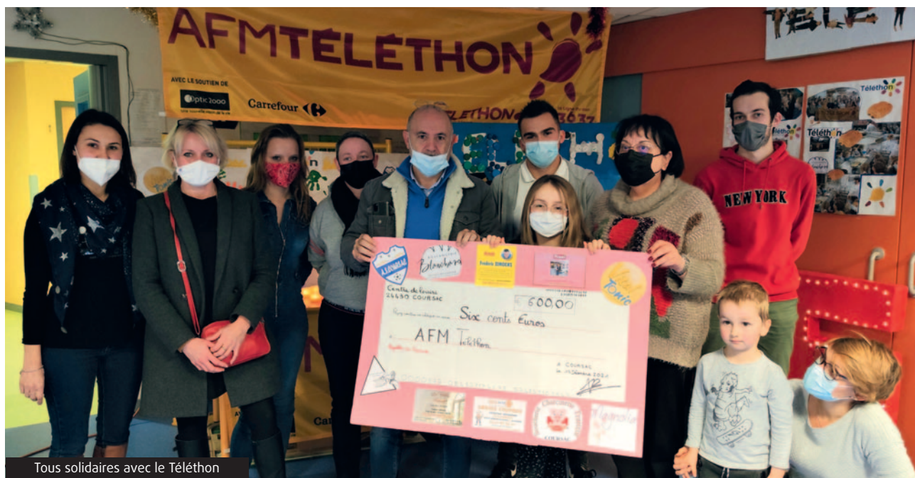
Tous solidaires avec le Téléthon

Tous les mercredis, durant la période scolaire les enfants de l'accueil de loisirs s'amuse autour d'un fil rouge nommé : " Ma commune sous un autre angle " qui se décline en cycle de vacances à vacances.