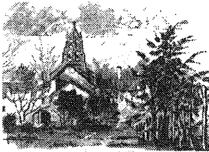
Mazerolles (86320) . Campanille du XIII e siècle