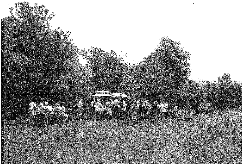
Après l'effort, le réconfort