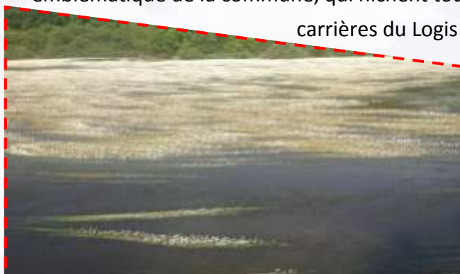
Renoncule flottante sur la Vienne