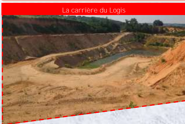
La carrière du Logis