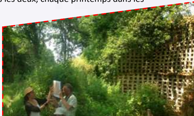
Le pigeonnier de Loubressac