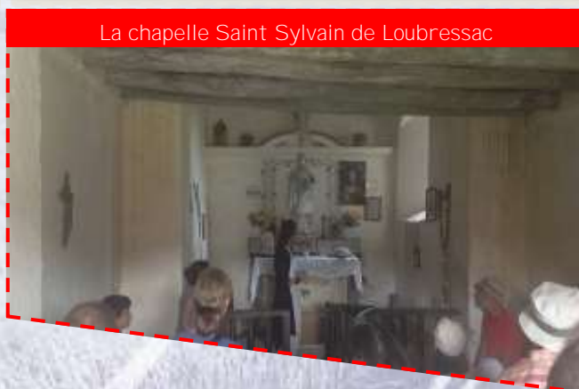
La chapelle Saint Sylvain de Loubressac