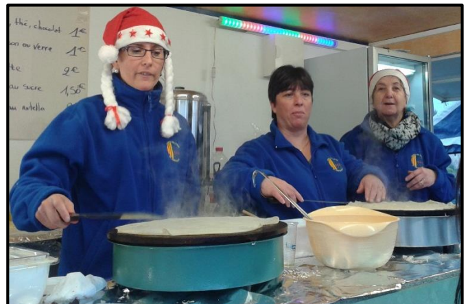
Coup de feu au stand des crêpes