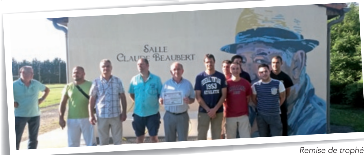
Remise de trophée