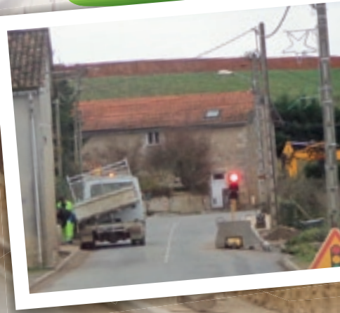
Travaux route de Bouresse

Civaux (face au cimetière), à la Grange (au carrefour de la rue de la Marnière et de la RN 147), à l'Aubergère, ainsi que rue du Gué dans le cadre de la réalisation du nouveau lotissement.