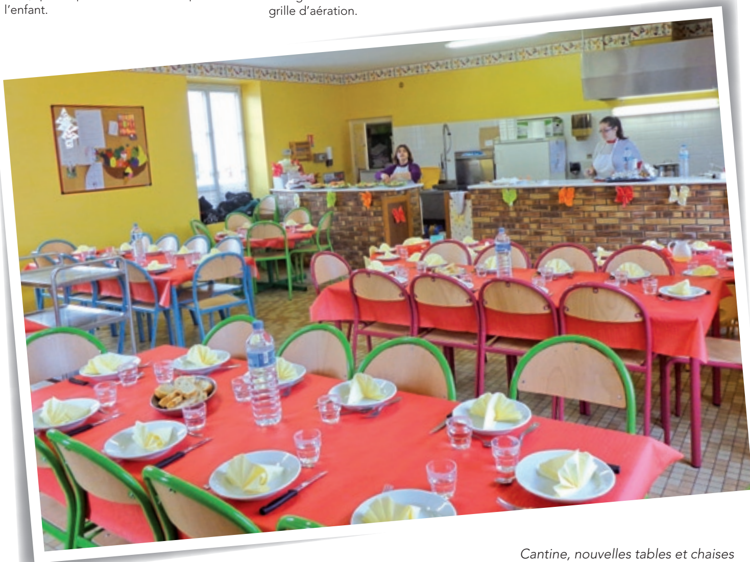
Cantine, nouvelles tables et chaises de couleurs vives

Afin d'améliorer le confort et faciliter le service, des tables rectangulaires et des chaises de couleurs vives ont été achetées. ■