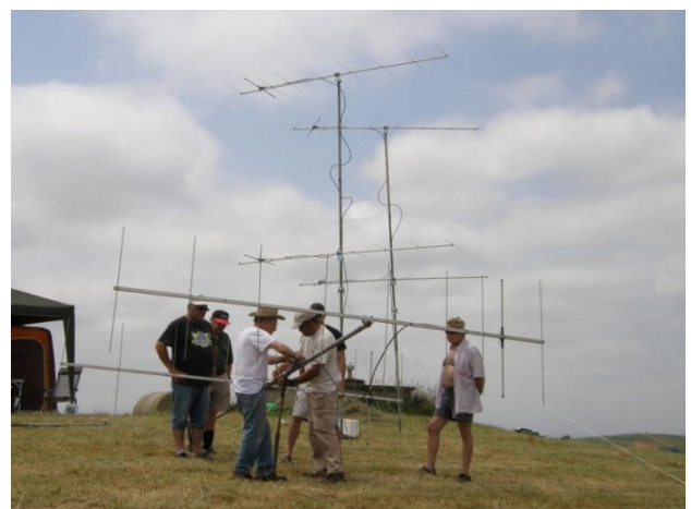
Montage de l'antenne au Pla de Pailhès

Pour plus d'informations, http://www.radionini.com/f5kcn.htm