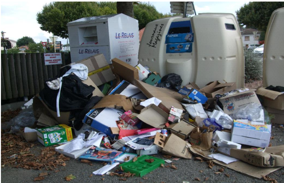
Superbe vue sur la place !!!

Pour le verre il est aussi facile de le mettre dans le récup verre que de l'entasser au pied de celui-ci.