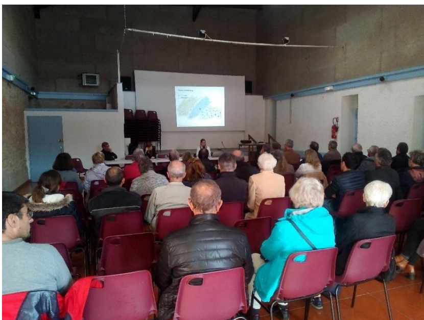
Réunion publique du 2 avril à Saint-Félix

Pour toute contribution ou requête, un registre de concertation est disponible dans chacune des mairies du territoire ainsi qu'au siège de la Communauté de Communes. Par ailleurs, si vous avez un projet particulier ou une demande spécifique, vous pouvez également écrire par courrier au Président de la Communauté de Communes, 20 rue Jean Moulin, 31250 REVEL.