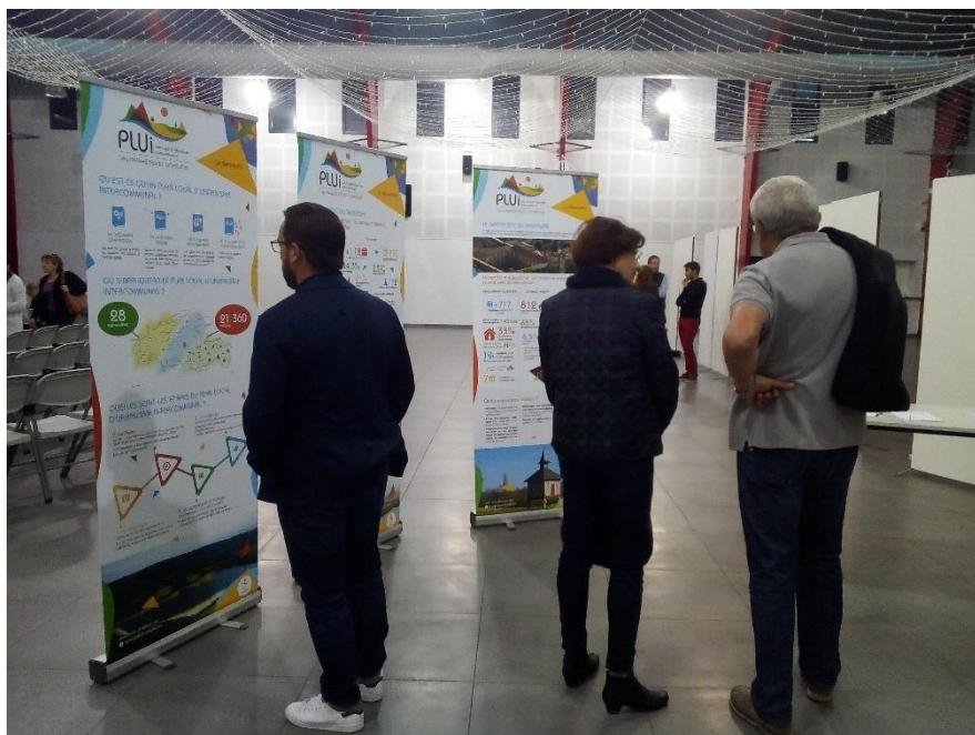
Réunion publique du 1er avril à Revel

Ces réunions publiques se sont tenues les 25 et 26 mars, puis le 1er et 2 avril 2019 sur les communes de Blan, Sorèze, Revel et St Félix Lauragais, rassemblant plus de 150 personnes.