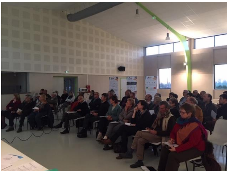
Réunion publique du 26 mars à Sorèze

Dans le cadre de la présentation aux administrés de la première étape du projet de PLUi, quatre réunions publiques sont venues enrichir le diagnostic de territoire et l'état initial de l'environnement.