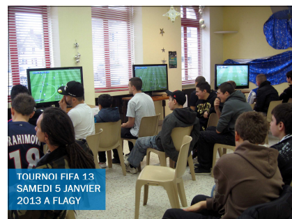
TOURNOI FIFA 13 SAMEDI 5 JANVIER 2013 A FLAGY