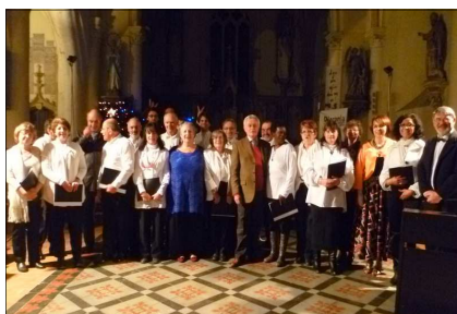
CONCERT DE NOËL

Il faut noter la participation de quatre musiciens de la Renaissance vouloise pour deux « Nocturne » de Mozart et l'hymne anglais « Land of Hope and Glo-