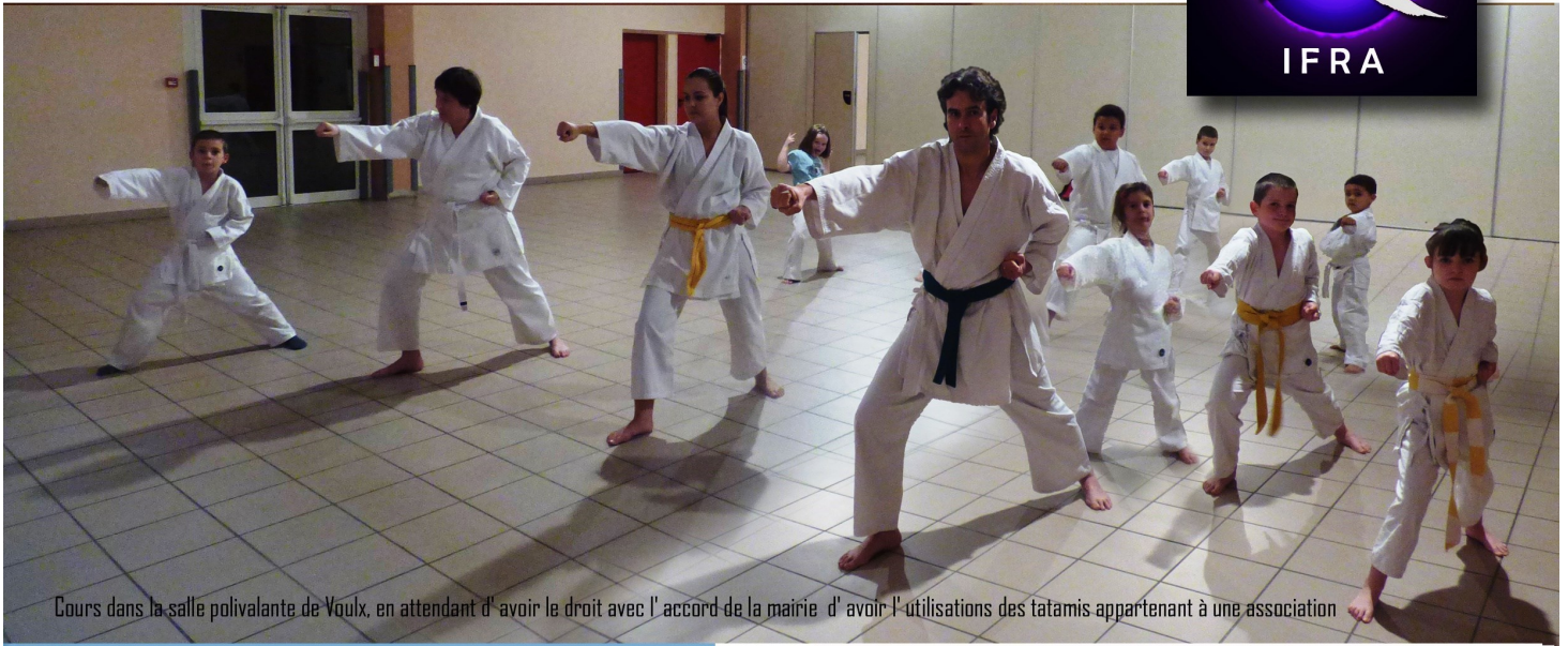
Cours dans la salle polyvalente de Vouix, en attendant d'avoir le droit avec l'accord de la mairie d'avoir l'utilisations des tatamis appartenant à une association