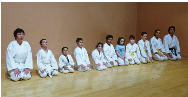
Le salut traditionnel enseigné pour le respect de l'autre et son grade.