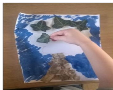
coller les feuilles