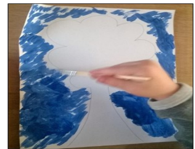
peindre le ciel