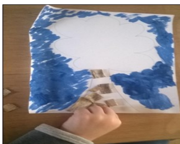
coller le tronc