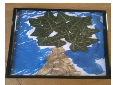
mettre sous verre