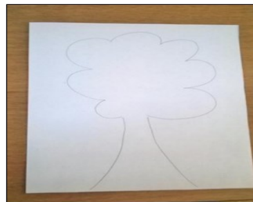
dessiner un arbre