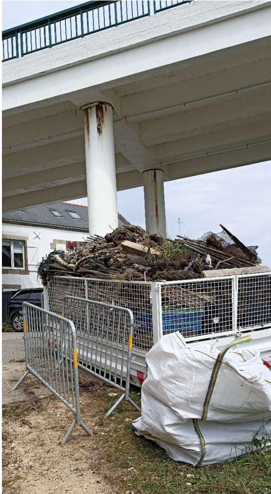
Benne chargée de déchets non recyclables