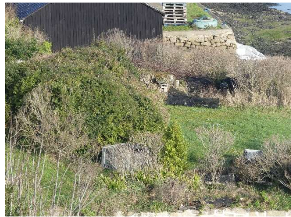
Nombreux plants de Baccharis âgés