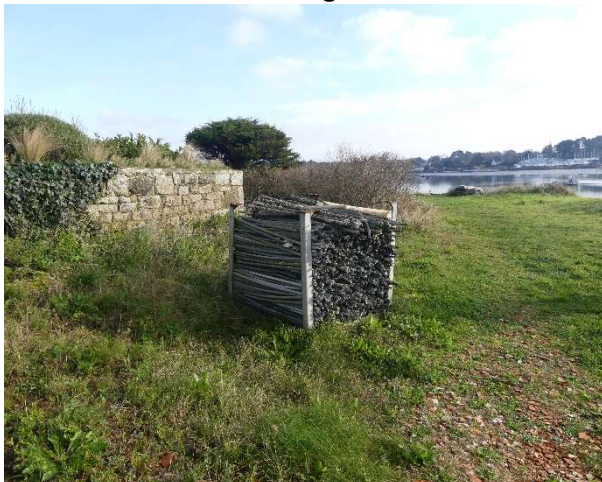
Caisse avec tubes plastiques de captage