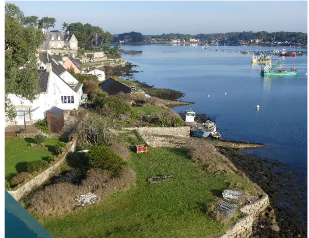
Avant le nettoyage