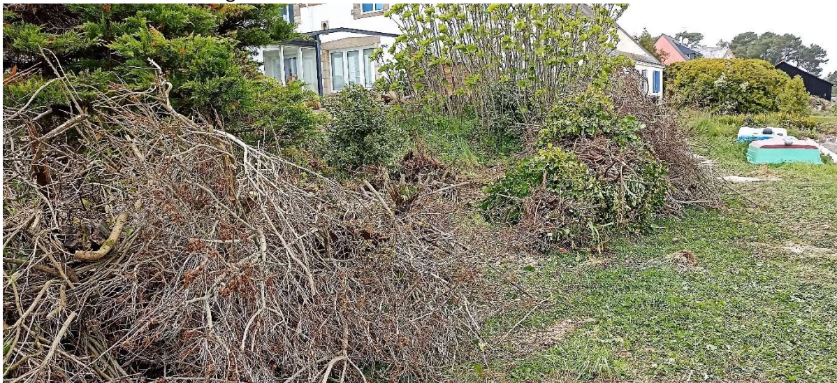
Tas de branchage de Baccharis à évacuer ultérieurement