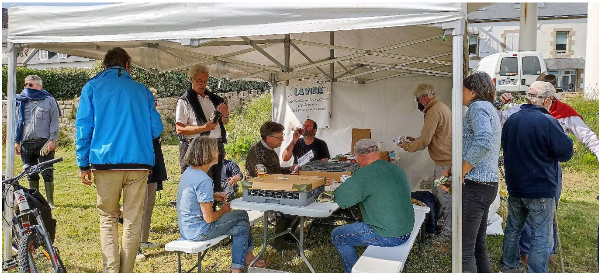
Moment d'échanges et de convivialité. Les personnes présentes étaient toutes enthousiasmées de participer à ce chantier sous le pont et permettre ainsi la mise en valeur de ce secteur remarquable et souvent méconnu © la Vigie