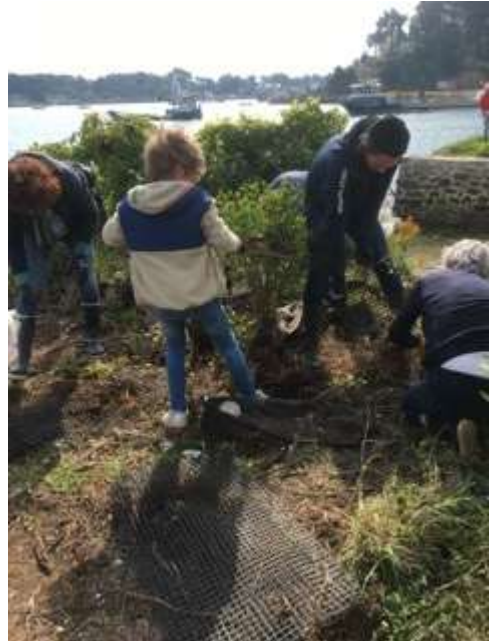
Les enfants ont aussi participé activement et ont été sensibilisés à la protection de la nature et de l'environnement