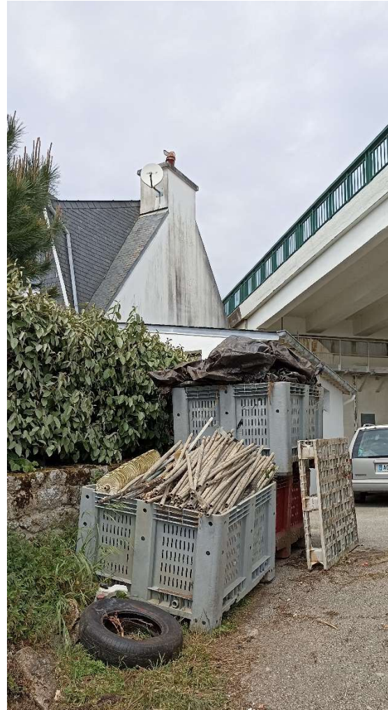
Caisse à évacuer