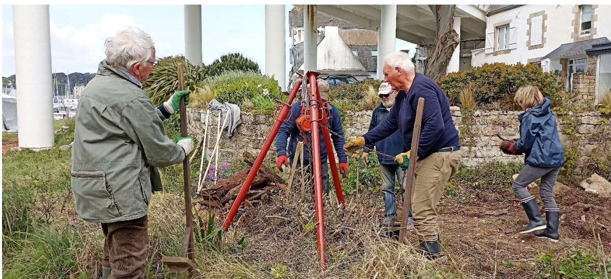
Arrachage de souche ancienne de Baccharis avec un palan à chaîne prêté par le Syndicat Mixte de la Ria d'Etel