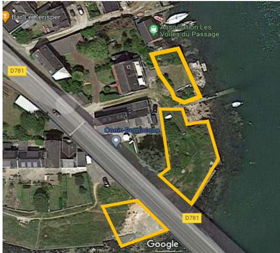
Photo aérienne des 3 zones