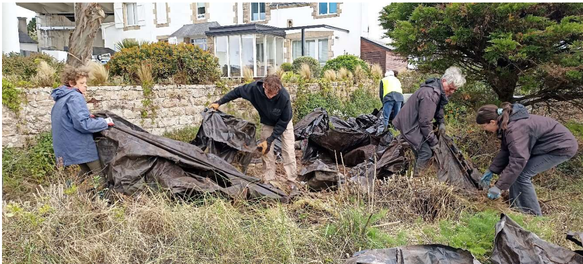
Enlèvement d'une bâche recouverte d'herbe