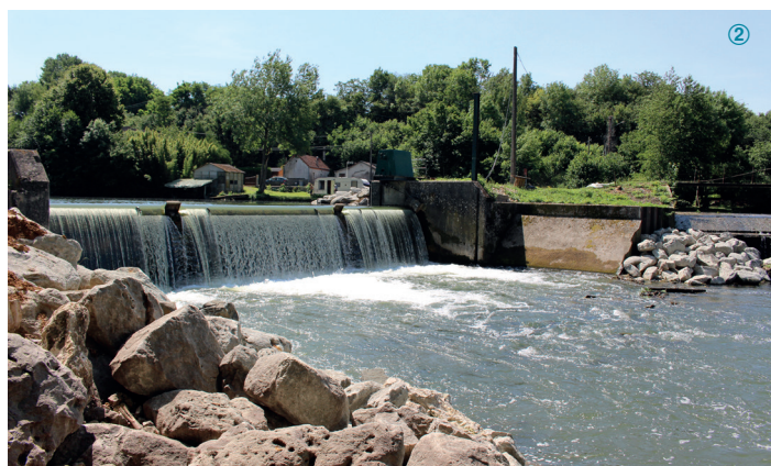
③ Le Loir