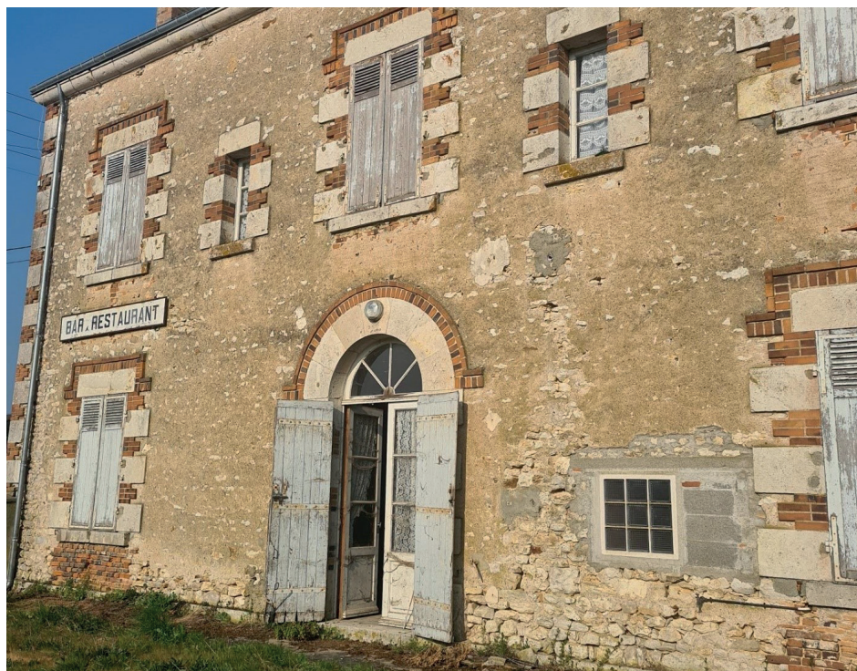
Ancien presbytère d'Ouzouer-le-Doyen