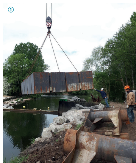
① Travaux de l'ouvrage de Courcelles (avril 2020)

Le financement du fonctionnement de la GEMAPI et des actions entreprises est assuré par la CPHV. Le législateur a prévu la possibilité d'instaurer une taxe pour financer cette compétence devenue obligatoire. Les délégués communautaires, ont instauré cette taxe dont le produit attendu est déterminé tous les ans en fonction des besoins de financement : son produit ne peut financer que les actions concourant à la mise en œuvre de la compétence.