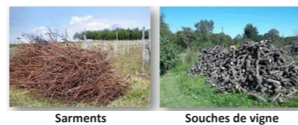
Déchets issus de pépinières viticoles