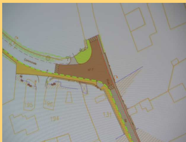
Aménagement du carrefour rue de Rohan

NB : Précisons que la démolition de l'ancien Foyer Logement a été retardée mais elle devrait intervenir à l'été 2017. La construction des 8 maisons par Côtes d'Armor Habitat suivra de peu. Cette réalisation transformera sensiblement la rue Anne de Bretagne. Elle apportera une réponse attendue à des personnes âgées ou des jeunes ménages à la recherche de logements en centre bourg.