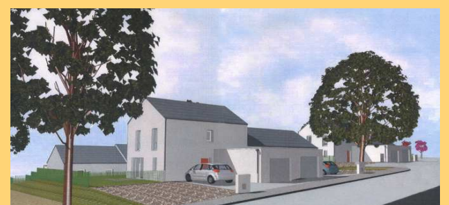
Lot de 8 maisons par Côtes d'Armor Habitat