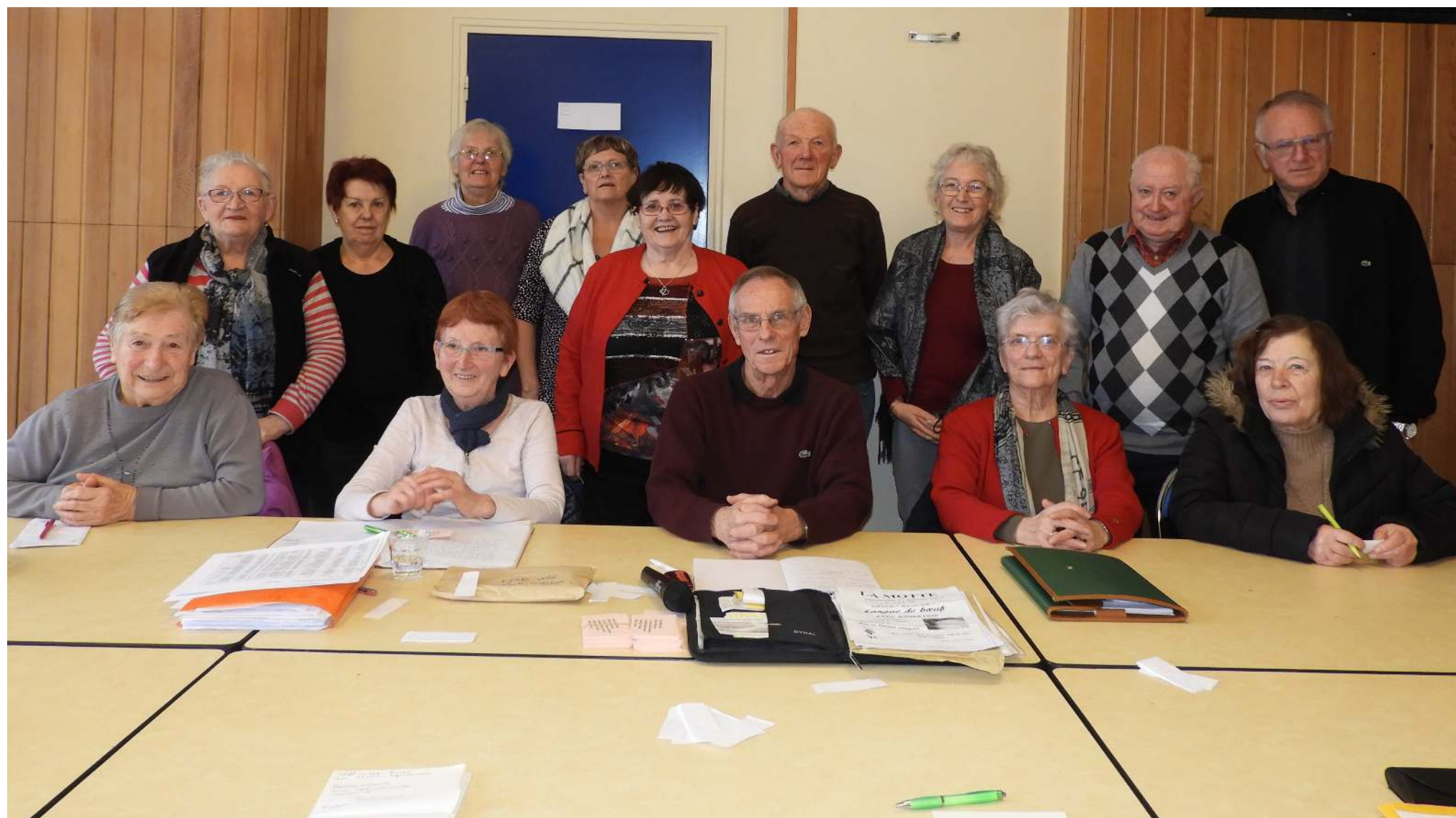
Composition du nouveau bureau