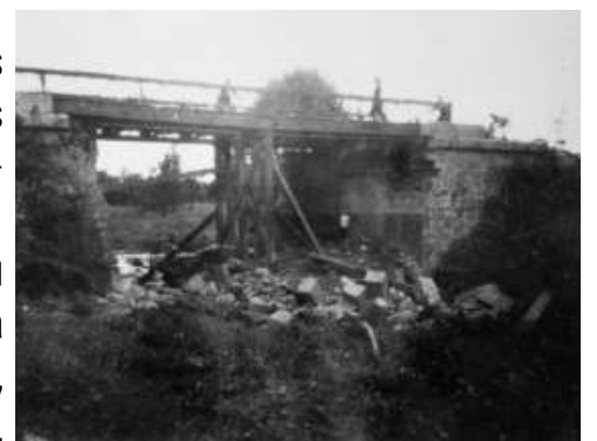
Destruction du pont de Querrieux par les Allemands le 3 août 1944

Si vous en possédez, du bourg, des villages, de la vie quotidienne, des fêtes, des commerces (épicerie, boucherie, boulangerie...), des métiers (boucher de campagne, métiers du bâtiment...), des travaux (à la campagne, dans les écoles, de voirie, sur les bâtiments...), des loisirs (fête du village, kermesse...), des manifestations religieuses (pardons, Rameaux...) elles nous intéressent.