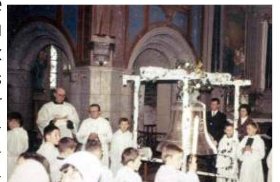
Bénédictio de la cloche le 17 décembre 1967

Merci de contacter la mairie (02 96 25 00 49) ou François Cojean 06 43 72 03 30 qui se déplacera pour les scanner, le propriétaire conservera ainsi son original.