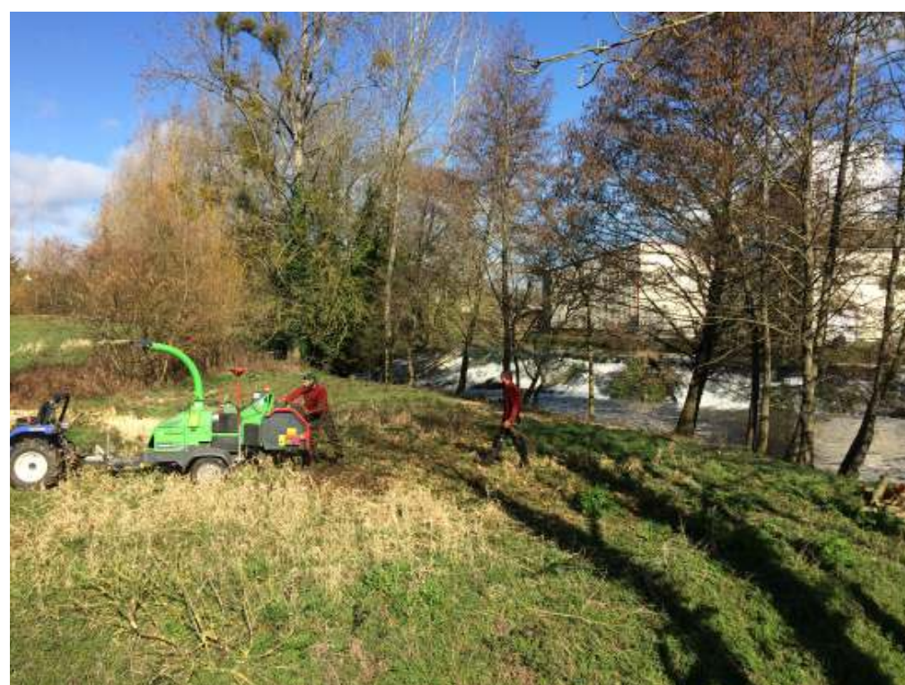
Élagage au pont du moulin

A la gare, au « Pré du Doué », dans la cour de l'école d'Hilvern ainsi qu'à proximité du restaurant scolaire et au pont du moulin, c'est l'entreprise « GWEZENN élagage » de Plémet qui a procédé à des interventions délicates. Ainsi, le peuplier tombé sur le déversoir du pont du moulin a pu être dégagé et débité et la haute cépée proche d'une maison au « Pré du Doué » a pu être retirée sans dégâts.