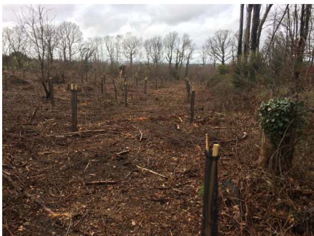
Site de Saint-Quidic

A Saint-Quidic, après une préparation sommaire du terrain, la plantation de châtaigniers (675 plants) et de hêtres (675 plants) a été réalisée par l'entreprise LUCIA de Gouarec. Un plant sur trois est tuteuré et protégé contre la gourmandise des chevreuils et autres mammifères. Le devis des travaux sur 1ha, s'élève à 6083 € TTC, auquel s'ajoutent 500 € /an pour le suivi et l'entretien de la plantation pendant 3 ans. A noter que l'état de la plantation peut surprendre mais, selon l'entreprise, elle assure la protection maximale des nouveaux plants.