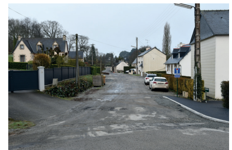
Rue des faubourgs