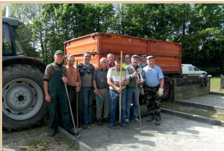
Vendredi 11 Mai au boulodrome concours de boules inter club inscription 13h30, toutes les personnes de Saint-Caradec sont les bienvenues. »

prochaine manifestation : concours de belote interne au club le 29 mars- salle des Ajoncs d'or, inscription 13h30.