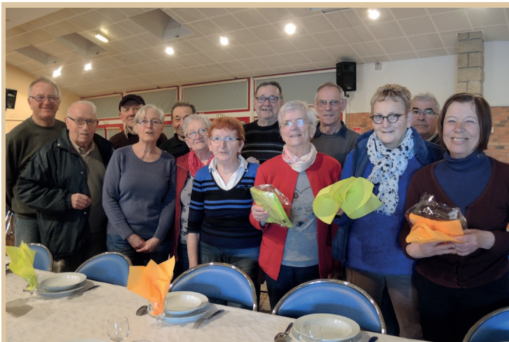
Le président et les membres du bureau remercient l'équipe de bénévoles qui a préparé et servi le "Repas jambon à l'os" du mars 4 mars 2018