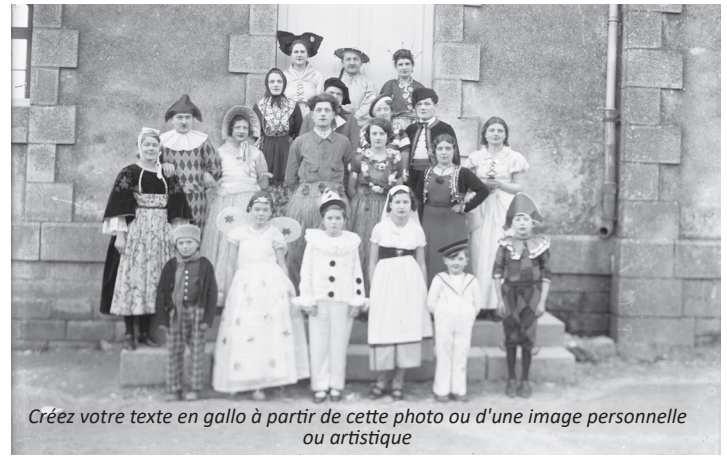
Créez votre texte en gallo à partir de cette photo ou d'une image personnelle ou artistique

N'oubliez pas de fournir la photographie qui vous a inspiré s'il ne s'agit pas de celle proposée.