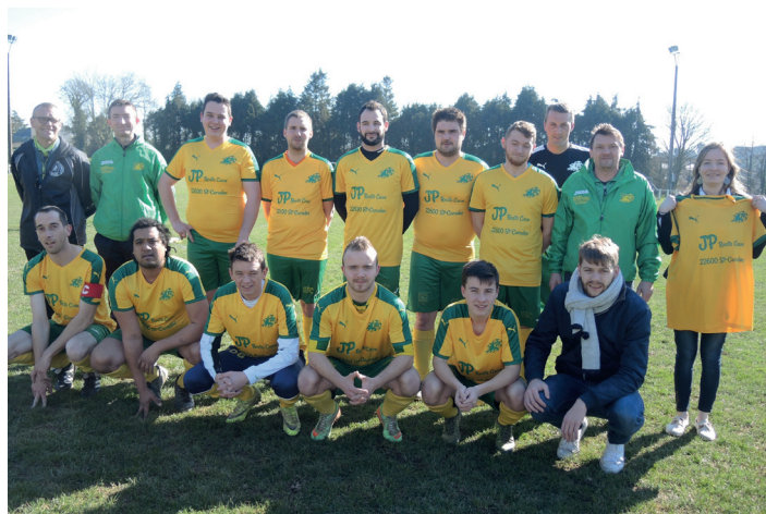
Remise du jeu de maillots à l'équipe seconde