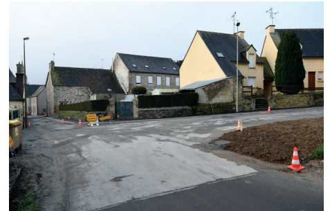
Carrefour route de Saint-Thélo

➤ Voirie haut de la rue Anne de Bretagne et impasse Surcouf. Réaménagement et réfection des chaussées et trottoirs dans le but de réduire la vitesse des véhicules, en même temps qu'une remise à neuf. A noter la création d'un réseau d'eaux pluviales souterrain en lieu et place des écoulements sur la chaussée. La grande place à hauteur de l'une des entrées du stade de foot-ball a été agrémentée par une vaste aire gazonnée. Celle-ci permet aussi de réduire la largeur de la rue Anne de Bretagne à cet endroit et ainsi de ralentir la vitesse. Coût total (hors eau potable, prise en charge par le Syndicat d'Hilvern) : 152 000 euros. Le reste des travaux sur la rue Anne de Bretagne et ses voies annexes a fait l'objet d'une seconde tranche de marché avec la même entreprise pour un montant de 220 000 Euros. Ils seront réalisés à la fin du chantier de Côtes d'Armor habitat c'est-à-dire à la mi-2019.