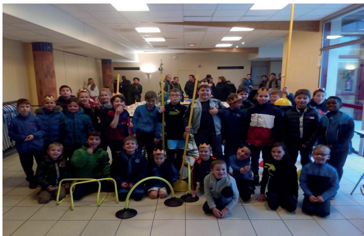
Traditionnelle galette des rois des enfants de l'USC

Nous vous attendons nombreux au stade pour soutenir les jaunes et verts.