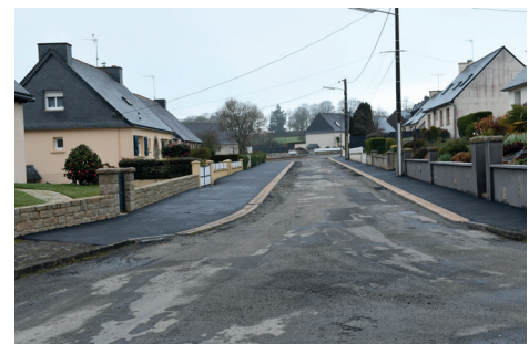
Rue Anne de Bretagne