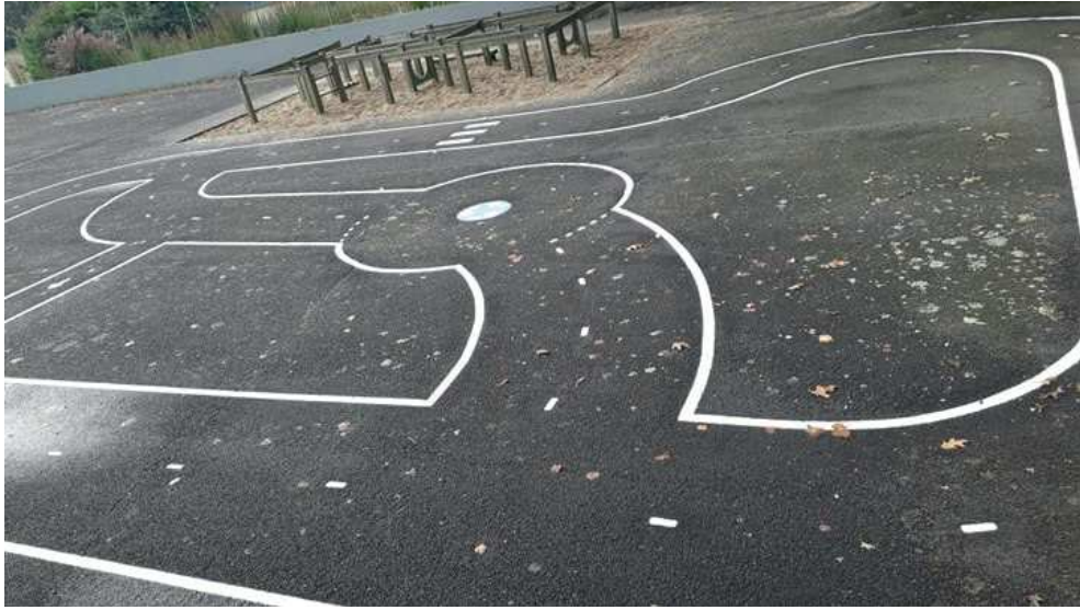
Nouveaux marquage pour les vélos

L'école d'Hilvern remercie la municipalité pour le financement de nouveaux jeux de cour. A la mi-octobre ont été installés un circuit de billes et un circuit de petites voitures. Le marquage au sol d'un parcours de vélos fait déjà le bonheur des enfants.