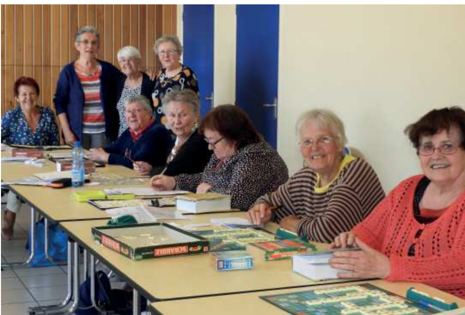
Scrabble duplicate : le mardi après-midi

Contact : Yvette Le Priol - 06 20 14 44 92-