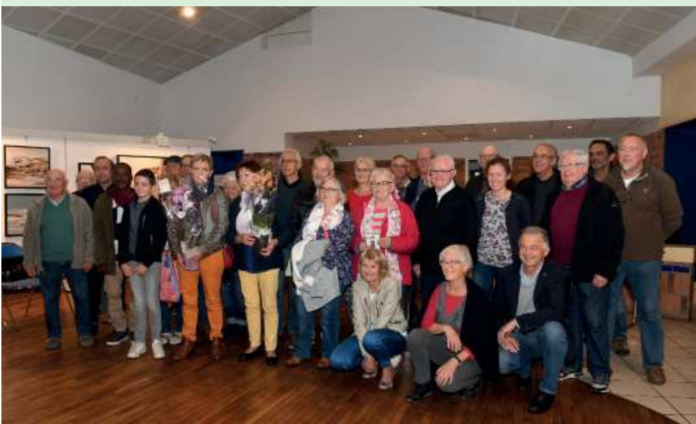
Lauréats du concours avec les bénévoles