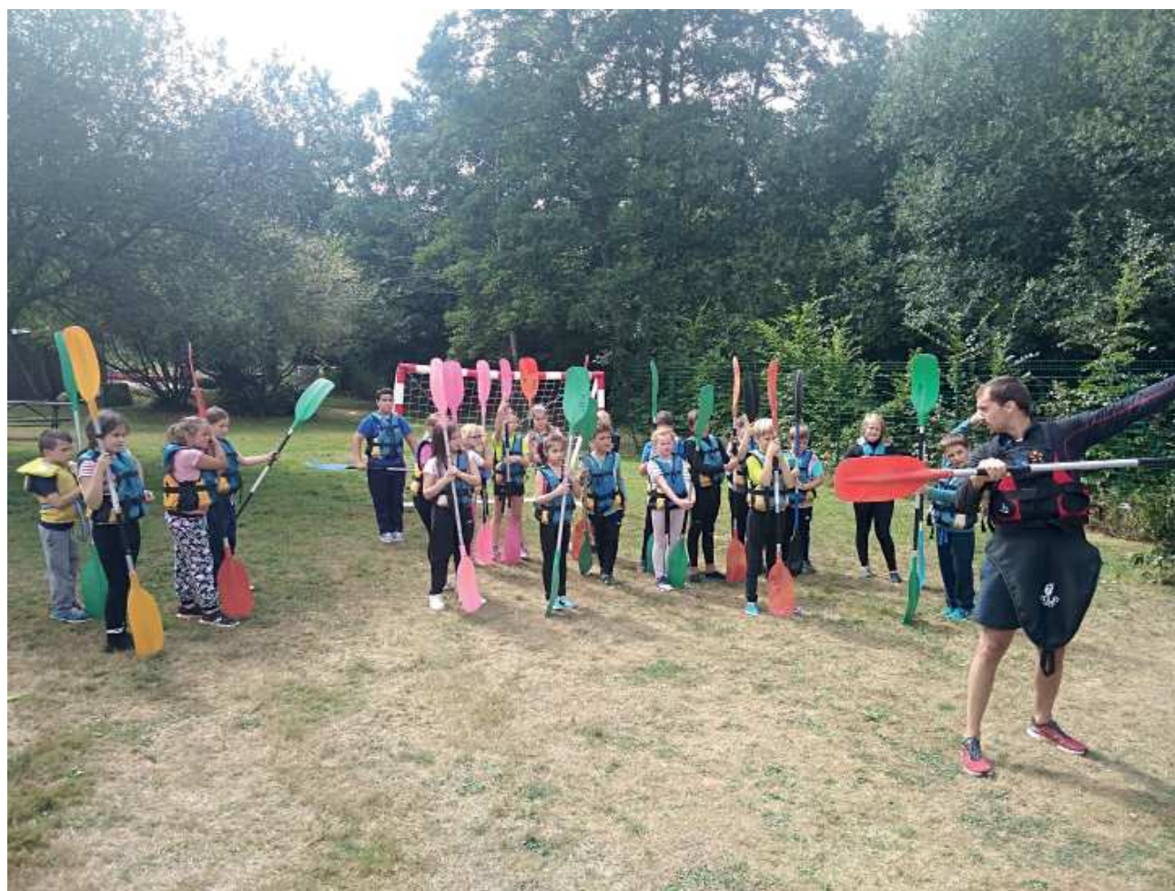
Préparation au kayak pour les grands

Nous participons à un cycle kayak de six séances à la base nautique de Pont Querra. Nous avons d'abord appris à choisir un gilet de sauvetage et une pagaie adaptés à notre taille. Nous savons maintenant embarquer et débarquer seuls ainsi qu'aller tout droit en avant ou en arrière. Nous avons hâte (et aussi un peu d'appréhension) de pouvoir descendre le déversoir ! Les CE2-CM1-CM2 de l'école d'Hilvern