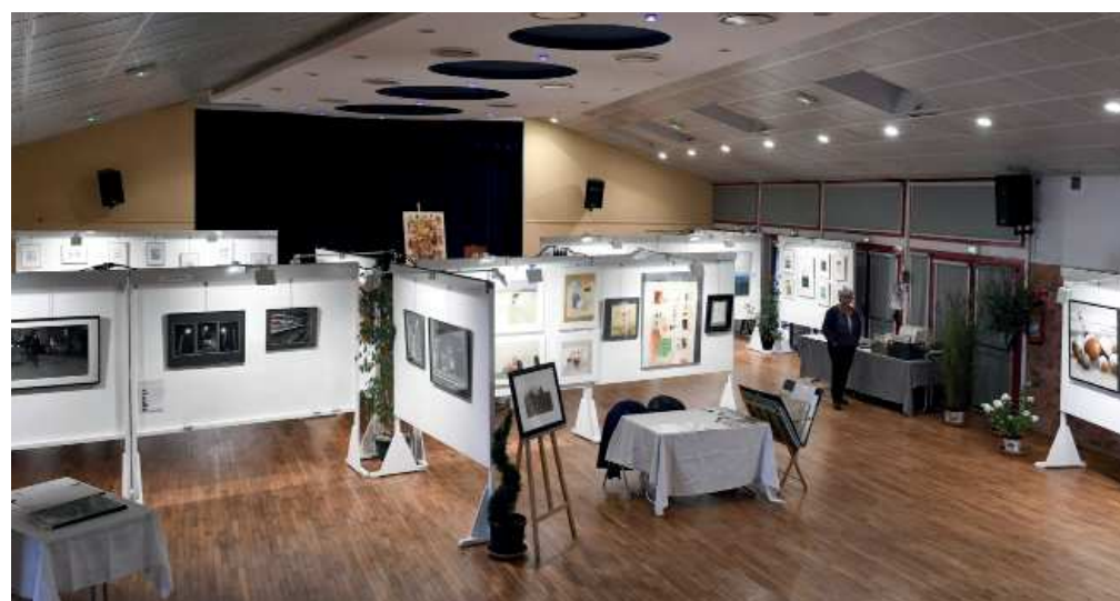
Salle des Etoiles

L'exposition restait visible du lundi au vendredi suivant et des ateliers de découvertes pour les écoles des environs ont été organisés