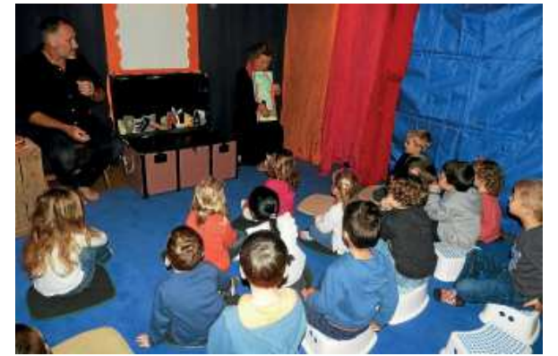
Les élèves conviés dans la cabane à contes