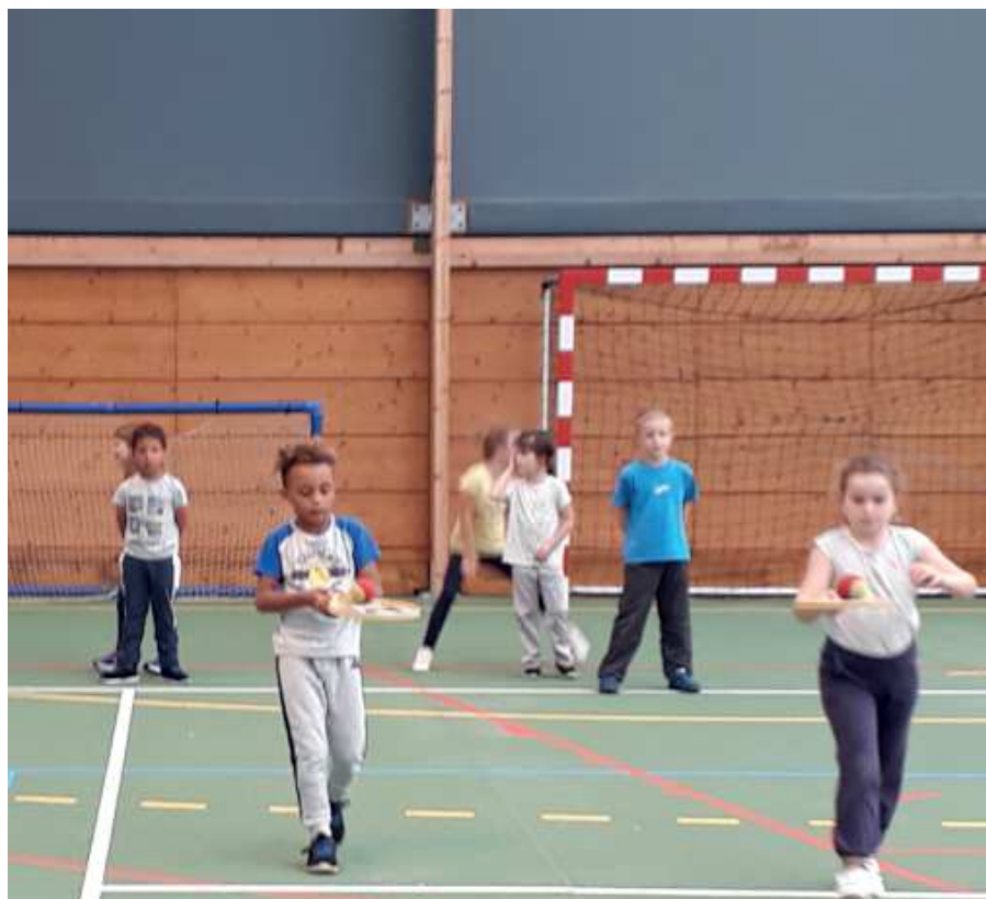
Les élèves ne doivent pas faire tomber la balle