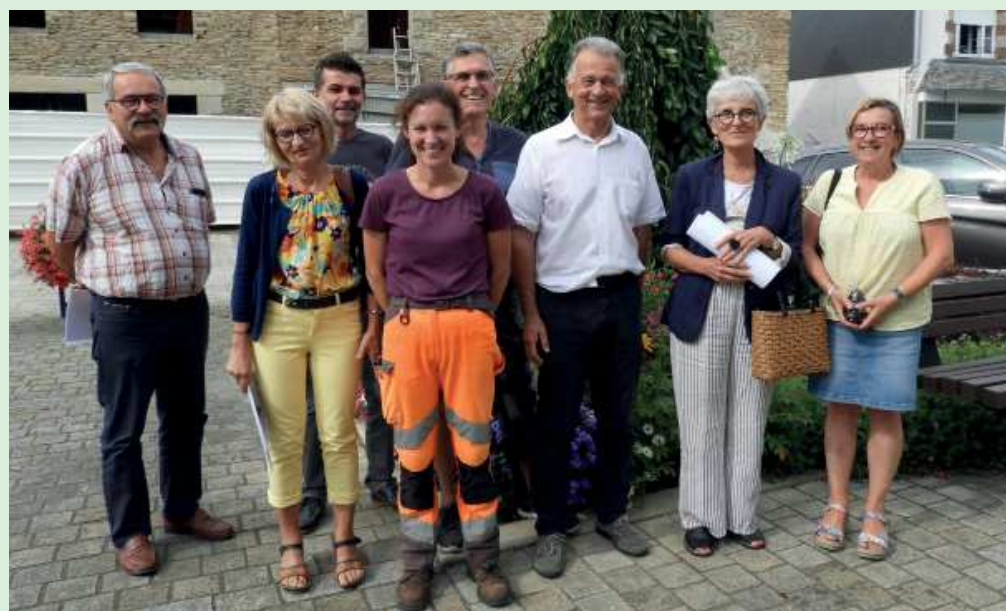
Visite du bourg par le comité départemental

Le label constitue un outil d'aide au quotidien pour les communes qui souhaitent améliorer le bien-être de leurs habitants et préserver l'identité de leurs territoires, tout en développant leur attractivité. Notre commune s'est inscrite dans cette démarche, s'en est suivie une visite du comité pour évaluer notre potentiel. Les résultats de la compétition de la commune pour la 1ère fleur auront lieu au mois de novembre.