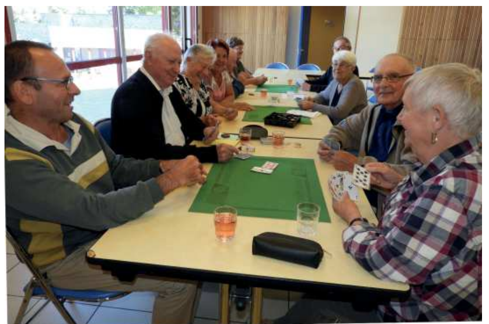
Jeux de cartes, de société ... ..