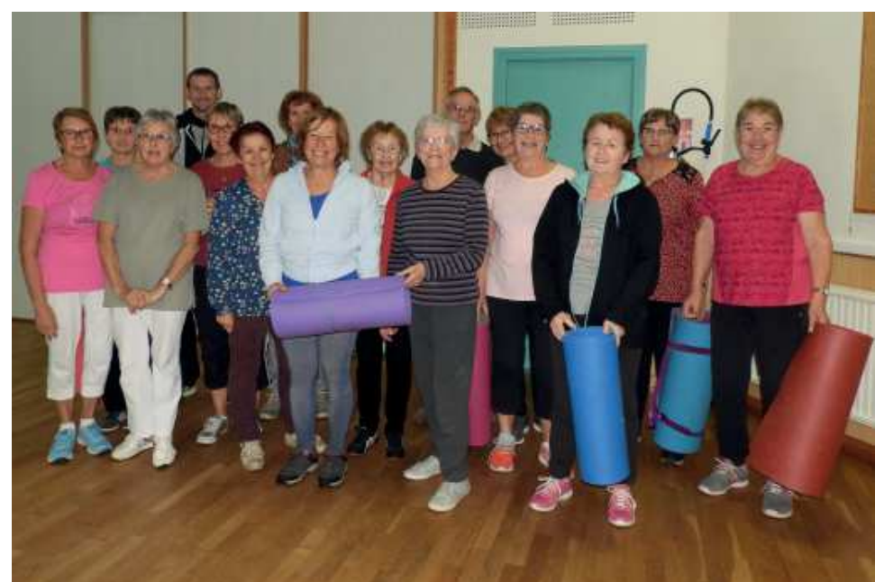
Gymnastique : le mercredi matin