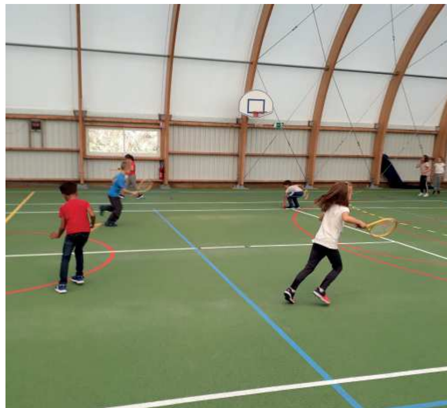
Les CP-CE1 jouent au tennis