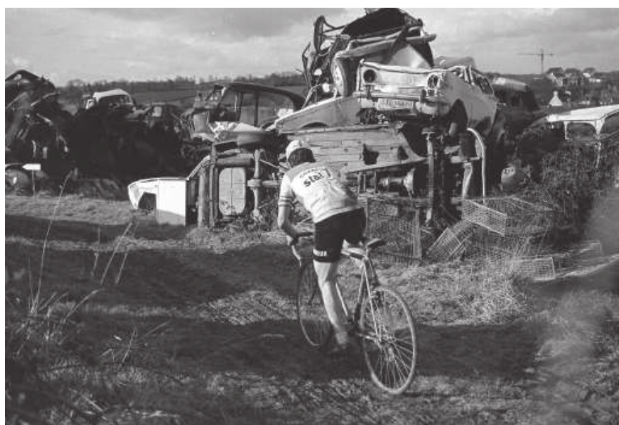
Cyclo-croos à Saint-Caradec dans les années 70

Directeur de la publication : Alain Guillaume