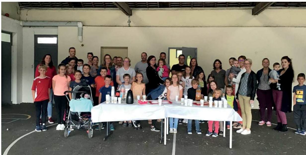
Elèves, parents, APE et équipe éducative se sont réunis pour un pot de l'amitié

Nous avons fait un goûter pour les familles vendredi 6 à 16h30 pour souhaiter une bonne rentrée scolaire à tout le monde. J'ai présenté l'équipe et rappelé les différents projets de l'année :