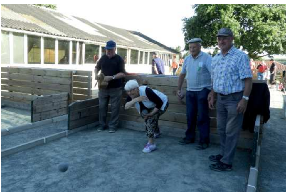
Parties de boules