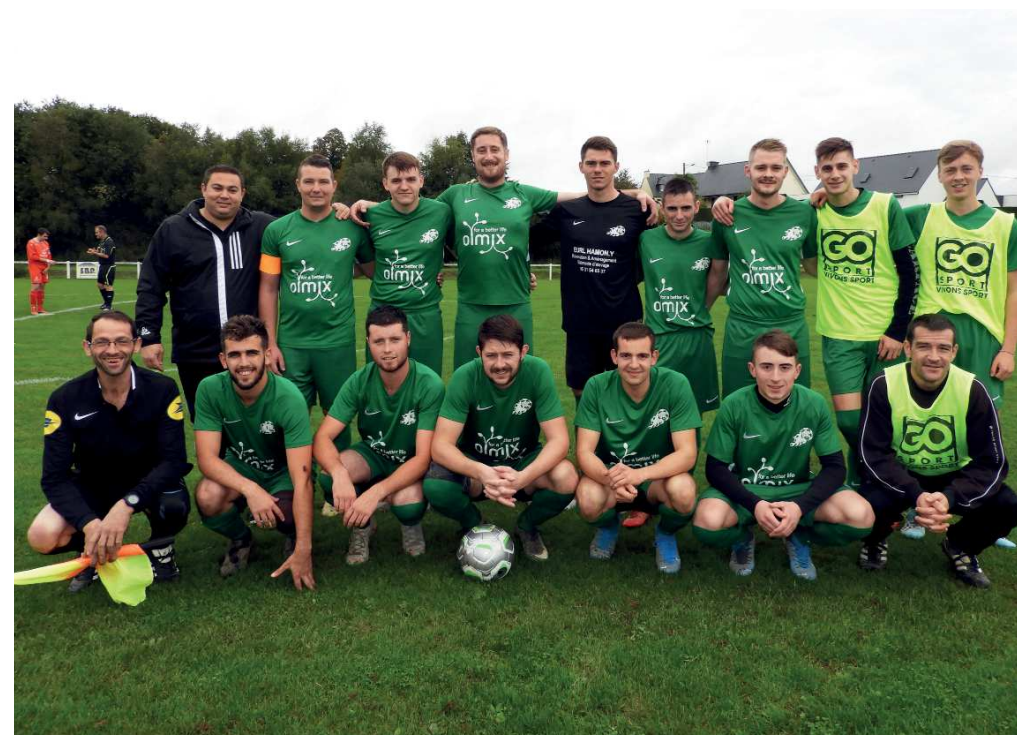
Belle victoire de notre équipe fanion en coupe du département contre Plémet, dimanche 13 octobre

N'hésitez pas à venir encourager les jeunes caradocéens le samedi et le dimanche au terrain des sports de Saint-Caradec. Pour tout renseignement, vous pouvez contacter Jordane COLLET au 06 79 26 42 05 ou Julie HOARAU au 06 71 69 42 06.