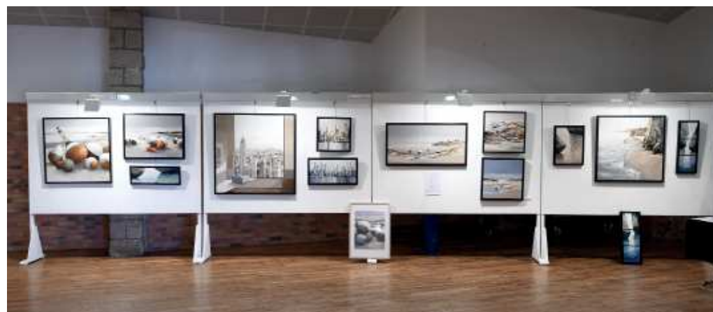
Espace de Pierre Joubert