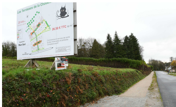
Chemin piétonnier : école d'Hilvern et lotissement

- Liaisons douces et chemins piétonniers entre l'école d'hilvern et le lotissement de La Croix d'une part et entre l'école d'hilvern et le lotissement des terrasses de la chouette Chevêche d'autre part. Après les élagages réalisés par l'entreprise JOLY, ces deux chemins piétonniers ont été restaurés et sablés pour faciliter les déplacements des piétons. De même pour le chemin entre la rue Anne de Bretagne et l'impasse Surcouf. Coût total : 6199 euros.