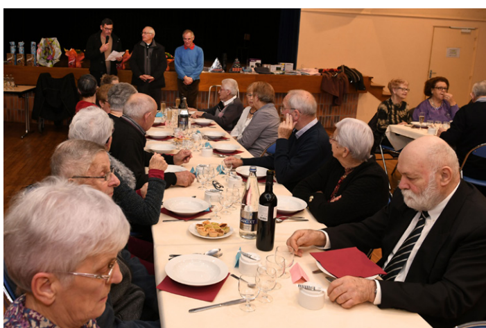
Table des 90 ans