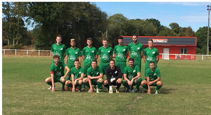
L'équipe A, en tête du championnat

Nouveauté cette saison, l'école de football est en entente avec les écoles de football de Trévé et La Motte. Ce que l'on peut dire, c'est que cette saison 2018/2019 est bien partie. Bien évidemment, l'année 2019 sera ponctuée de nombreux événements : bal costumé, tournoi jeune, tournoi nocturne. Nous attendons les caradocéens nombreux autour des terrains de football caradocéens.