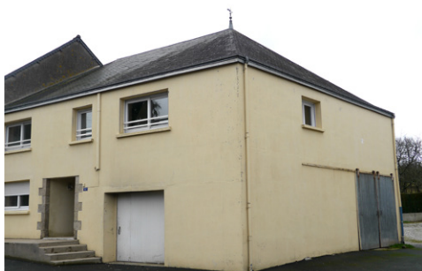
Immeuble, rue de la gare

2- A Sainte Emérentienne, une maison T4 avec jardin. Priorité, pour ce logement, sera donnée à une famille désireuse d'accéder à la propriété de son habitation. Renseignements en mairie.