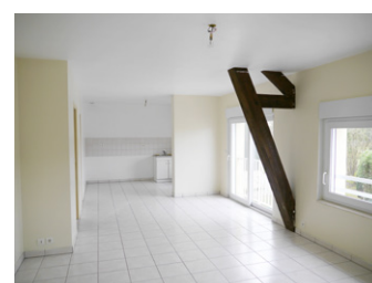
vue du séjour