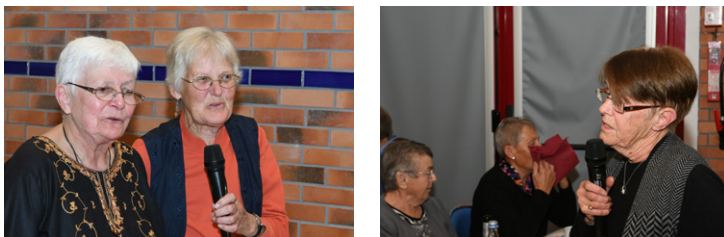
Certaines personnes ont poussé la chansonnette pour animer la fin du repas.