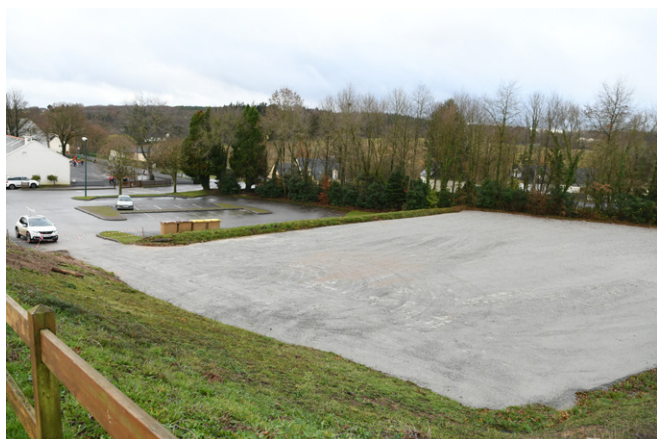
Parking du terrain de football