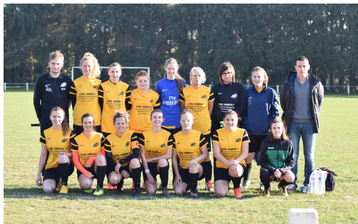
Seconde saison pour l'équipe féminine