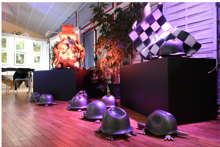
Petite scène avec les sculptures de l'invité d'honneur "Rol" de Cléguerec