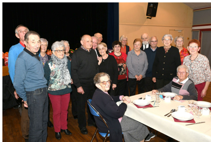
Les deux doyennes de l'assemblée entourées des membres du bureau