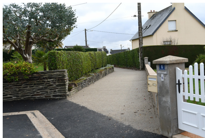
Chemin piétonnier lotissement de Kerjoie, impasse Surcouf