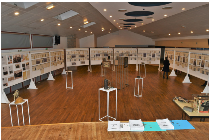
Une vue de l'exposition dans la salle des Etoiles