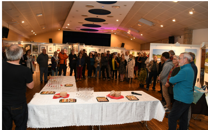
Vernissage de la ronde devant un public intéressé