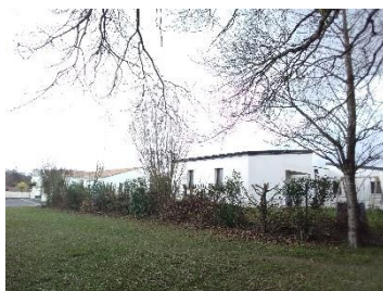
Haie plessée imp. des Terres Jaunes