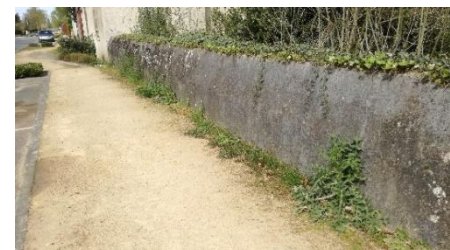
Pied de mur en cours de végétalisation, rue de Nantes