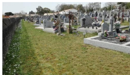
Pied de mur fleuri au cimetière

Les trottoirs servent essentiellement aux déplacements piétons. Aussi, quand ils sont suffisamment utilisés, l'herbe ne parvient pas à s'installer : leur fréquentation suffit à leur entretien. Dès lors, pourquoi s'échiner à vouloir supprimer les herbes spontanées qui se déploient sur les bords ou aux pieds des murs ? Ces plantes sont très utiles aux insectes en leur offrant leur pollen et leur nectar très tôt, dès la fin de l'hiver. C'est pourquoi nous désherbons les allées, les entrées de maison ou de garage mais laissons pousser les plantes en pieds de murs. C'est seulement quand elles seront fanées que nous passerons la débroussailluse.