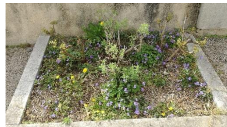
Massifs route des Sables

L'entretien consiste alors à accompagner la vie des massifs pour les mettre en valeur, rendre le tout esthétique, vivant et agréable à vivre.