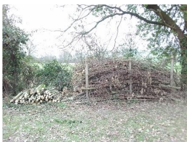
Haies Benje imp. des Terres jaunes