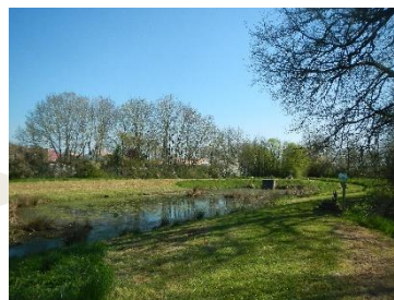
Tonte sélective et andin d'herbe tondu au Bassin d'orage

En fonction de l'utilisation que nous avons de nos espaces verts (terrain du vieux pont, petite chapelle, bassin d'orage, etc...), une place plus ou moins importante sera laissée aux hautes herbes qui sont indispensables au cycle de vie de nombreux insectes. Ainsi, les cheminements, les tours de tables de pique-nique, les zones de loisirs seront tondus régulièrement alors que les herbes hautes seront fauchées et évacuées une fois par an. Aussi, lorsque l'espace nous le permettra, nous laisserons sur place les tontes, par exemple en créant des andains. Cela nous fera gagner du temps, nous fera économiser du carburant (moins de tours en déchetterie) et pourra également nous servir à planter des arbres qui profiteront du paillage et de la décomposition des tontes.