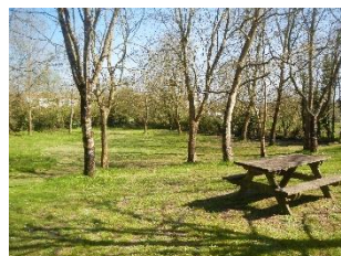
Tonte sélective au parc du périscolaire