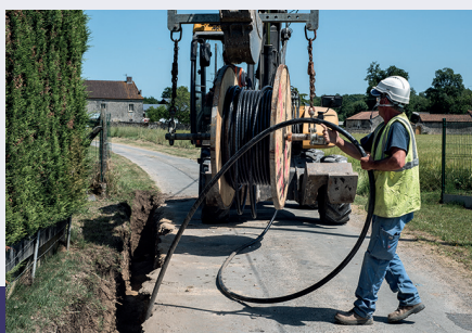
Contrôle et aménagement des réseaux d'électricité et de gaz