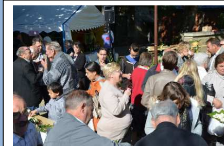
Fête de la Gastronomie