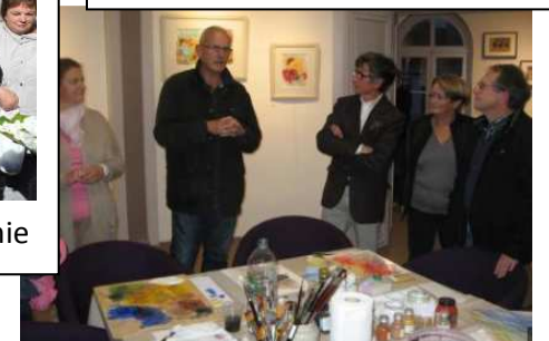
Exposition artistique à la halle