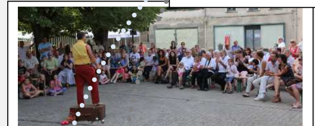
Samedi de caractère