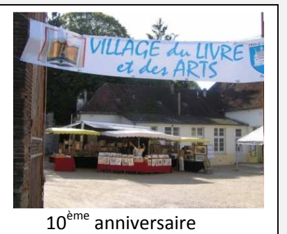
10 ème anniversaire

Ces résultats nous encouragent pour maintenir le cap et nous invitent à partager, tous ensemble, une audacieuse ambition pour notre cité.