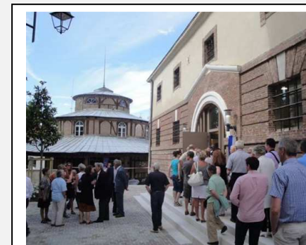
Inauguration de la Maison du Vitrail