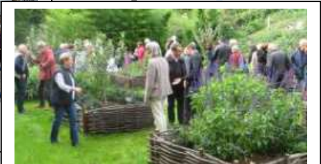
Inauguration du jardin médiéval