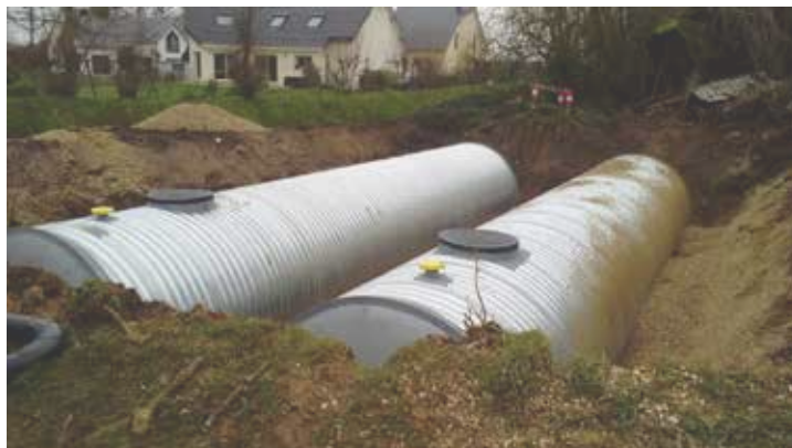
Photo ci-contre (février 2020) installation de la défense incendie du Poulrier, en réalité deux réserves de 60 m3 couplées. Une autre cuve de 120 m3 a été posée au Clair Bouillon une semaine plus tard. Les deux secteurs sont désormais en conformité au regard du risque incendie.