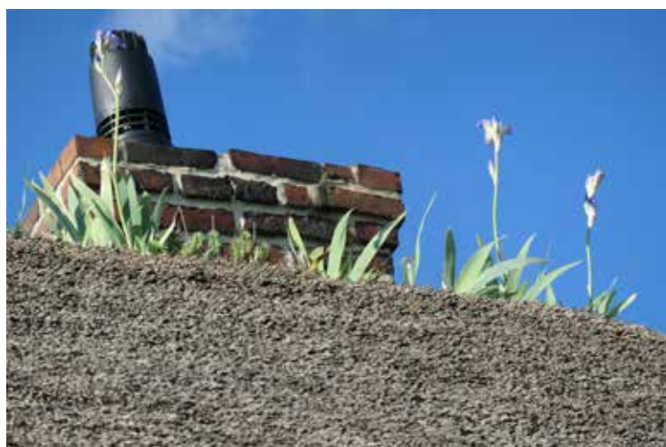
premiers iris en fleurs sur le toit de la mairie depuis la rénovation de la toiture de chaume