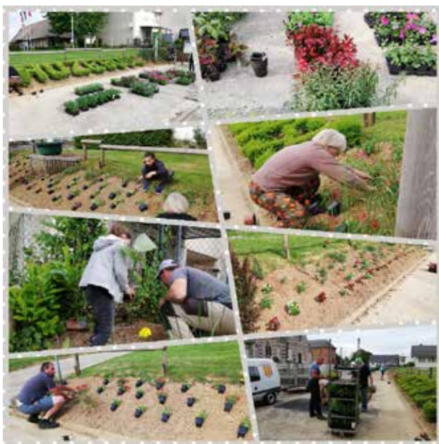
Le fleurissement de la commune le 22 et le 23 mai : merci aux élus volontaires qui se sont retrouvés avec plaisir après le déconfinement pour mettre en place un millier de plants !