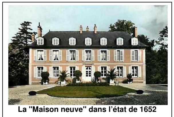
La "Maison neuve" dans l'état de 1652