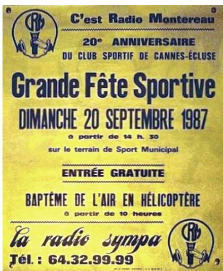
C.S.C.E. : Affiche de 1987