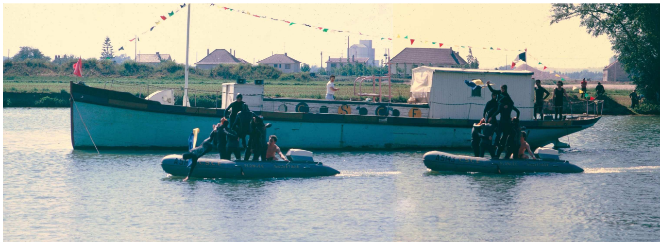
Fête nautique en 1973

Certaines de ces associations ont disparu, d'autres survivent malgré la difficulté à renouveler les dirigeants bénévoles, d'autres sont florissantes.