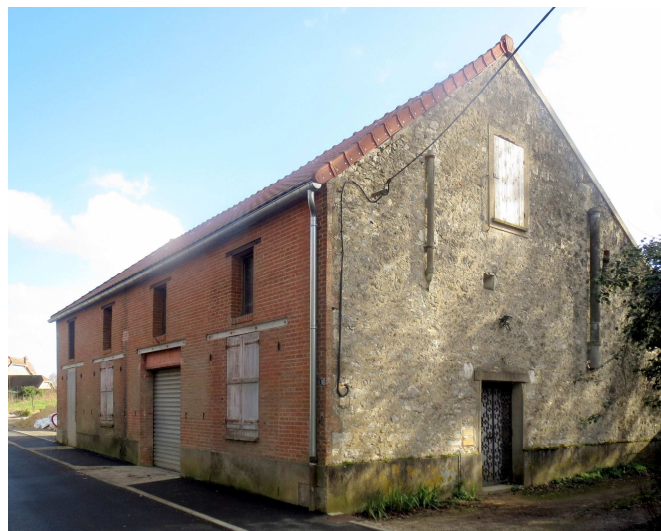
La "salle de gymnastique"

La Fraternelle répète et joue dans la "salle de gymnastique", rue du château, don de la comtesse Hélène de Fitz-James à la commune. Les jeunes en ont cimenté le sol et aménagé la scène, installant des vestiaires en-dessous. Des spectacles sont également donnés dans la salle arrière du café de la rue Désiré Thoison.