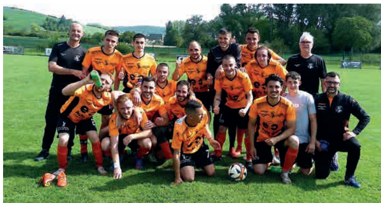
Honneur à l'équipe 1 senior pour son accession à la division supérieure (AURA)

vendredi 1 er juillet : AG du groupement de L'Auzon à 18 h au stade d'Orcet.