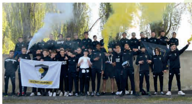
Tournoi international sur la Costa Brava pour les jeunes footballeurs U15 et u18 du groupement de L'Auzon

Attention : le nombre de places est limité, pensez à réserver.