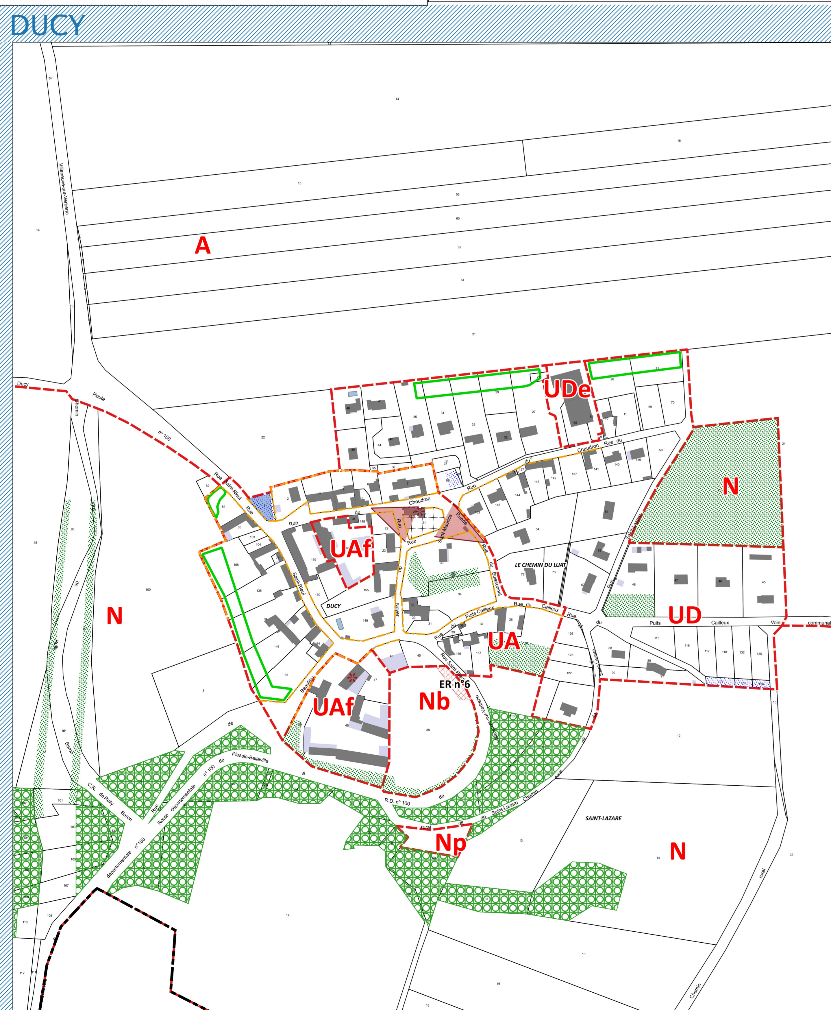
VOIR PLAN 1/5000e