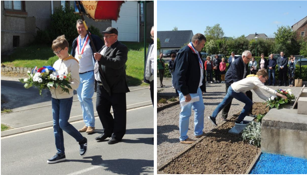
Dépôt d'une gerbe au monument aux morts