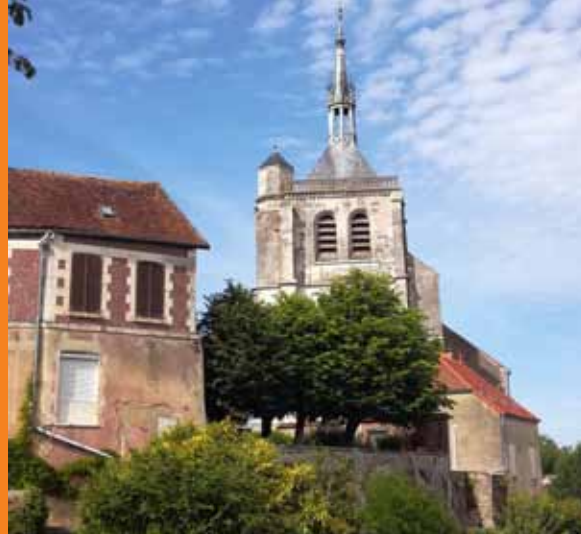
L'âme d'une cité médiévale