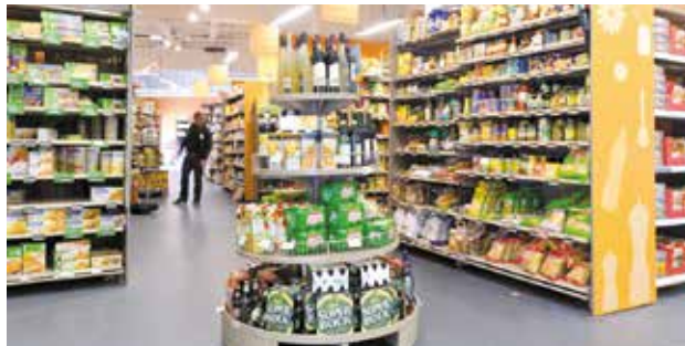
La limitation des déchets commence dès l'achat des produits.

C'est se procurer les produits neufs ou d'occasion dont on a besoin : les acheter, mais aussi les emprunter ou les louer. Lors de l'achat, c'est limiter les emballages, privilégier les produits durables, réutilisables, rechargeables et adaptés à nos besoins ! Voir pages 8 à 12.