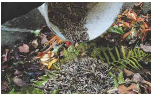
Faire son compost permet de réduire le poids de sa poubelle et de fabriquer un amendement de qualité.

«Utiliser ses déchets verts et de cuisine au jardin»