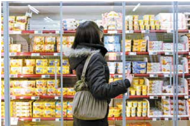
Évitez d'acheter des produits dont la date de péremption est proche.

vérifiez bien les dates de péremption des produits préemballés.