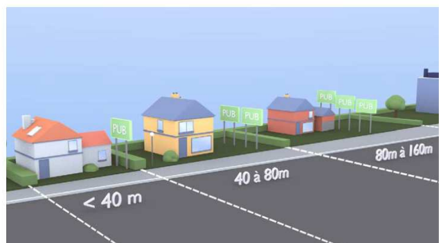
Un dispositif dans l'unité foncière dont la longueur bordant la voie est inférieure ou égale à 40 m. Deux dispositifs entre 40 m et 80 m. Un dispositif supplémentaire par tranche entamée de 80 m.