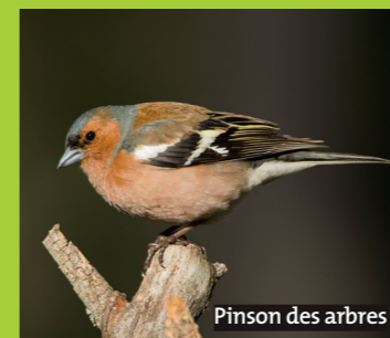
Pinson des arbres