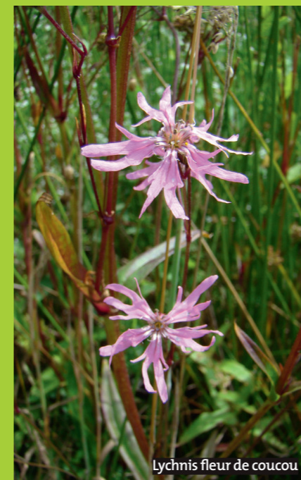
Lychnis fleur de coucou