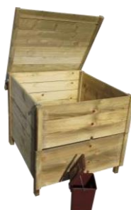
Modèle bois 575 litres