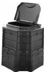
Modèle plastique 400 litres