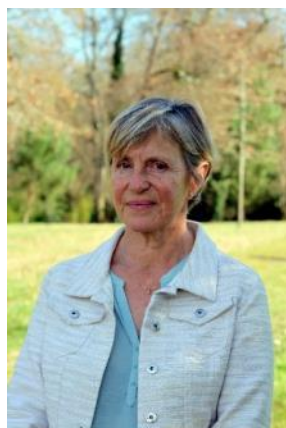
1 ère adjointe Communication/Voirie/ Jeunesse/Bibliothèque