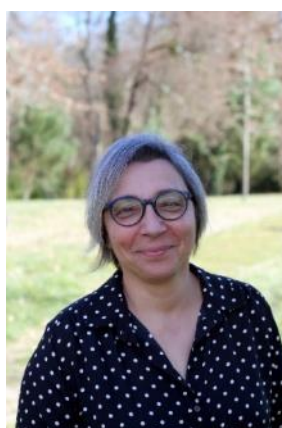
3 ème adjointe Fêtes patronales/ Associations/Tourisme