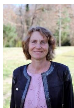
Conseillère municipale Périscolaire/Ecole