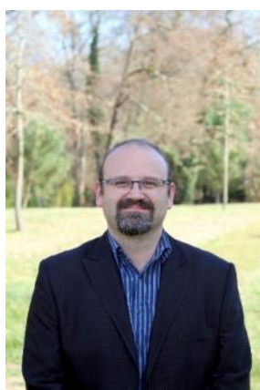
2 ème adjoint Finances/Sécurité/ Urbanisme/ Logements communaux