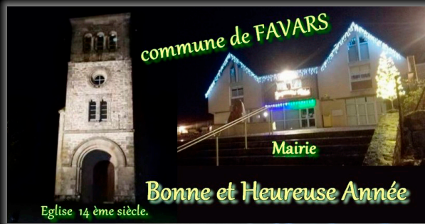
Merci à Mme Lacombe pour ce montage photo