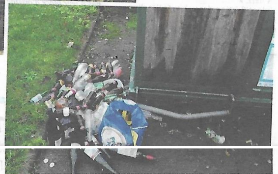
A Noyers-Saint-Martin, amoncellement de bouteilles au pied du conteneur, pourtant vide !

2020 aura été « une catastrophe. On a toujours eu des problèmes avec les conteneurs mais il y a les dépôts sauvages de plus en plus nombreux, et pas forcément à cause du confinement. Dans les chemins, je pense avoir ramassé jusqu'à 3 remorques de meubles et autres objets dont un piano ! On ouvre aux habitants une carrière pour déposer des végétaux jusqu'au mois de juin, mais elle