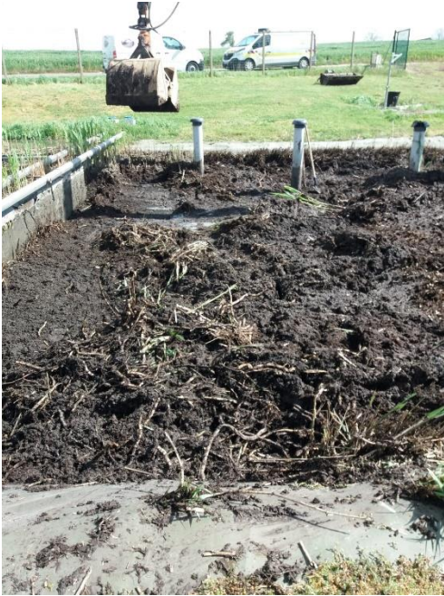
Illustration en photos :