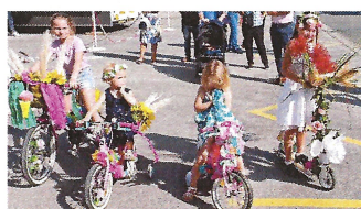
Concours de vélos fleuris, braves les enfants pour votre travail !