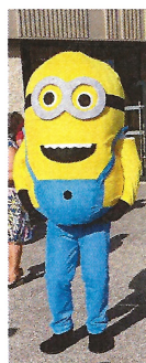
Mignon comme Mig....