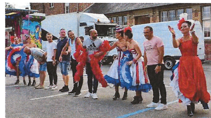
Une représentation de French Cancan très appréciée et participative. Des artistes très sympatiques et pros !