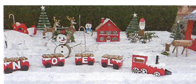
Décos de Noël réalisées par le personnel communal

Merci de respecter ce nouvel espace de jeux