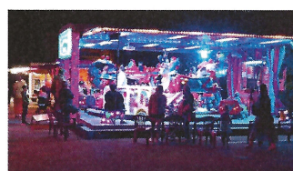
La fête foraine