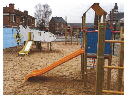
L'aire de jeux terminée

Merci de respecter ce nouvel espace de jeux