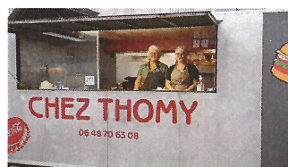
Restauration rapide et orchestre de qualité !