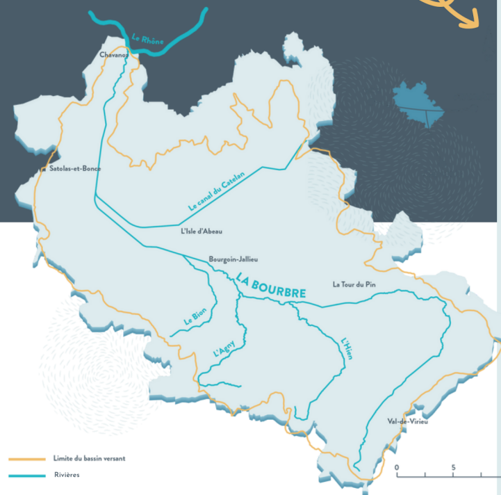
Carte du bassin versant de la Bourbre

Le territoire du bassin versant de la Bourbre présente des risques importants en cas d'inondation.