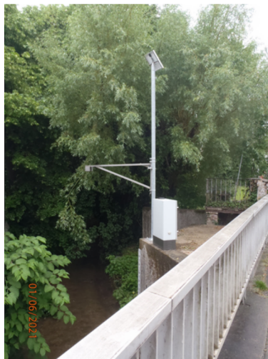
Station de mesure sur le Bion à Bourgoin-Jallieu

→ l' installation d'un réseau de stations de mesures permettant de mesurer le niveau des cours d'eau du territoire sur plusieurs zones à risques (suivi du niveau des cours d'eau en temps réel et avertissement envoyé par SMS aux mairies en cas de montée des eaux)