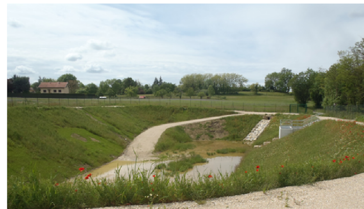
Bassin de rétention des eaux de Comberadix à Bourgoin-Jallieu

Quelques exemples de travaux réalisés ou en cours de réalisation dans le cadre du programme :