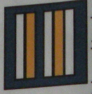
Cadre supérieur de santé