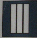
Cadre de santé 2 e classe