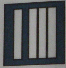
Cadre de santé 1 er classe